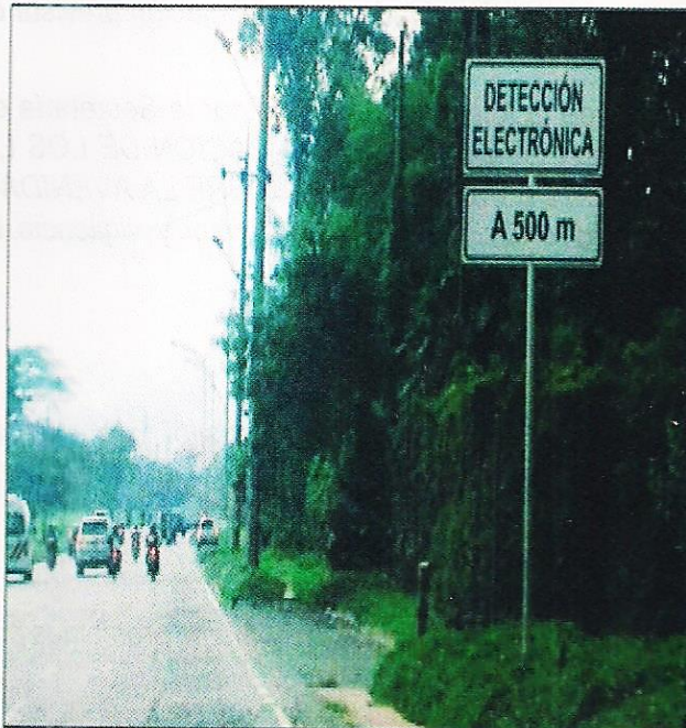
Imagen No. 5. Fotografía allegada por la ciudadana a través de la comunicación Supertransporte con radicado No. 20195605420792 de 14/05/2019.

Avenida regional. Aproximadamente 50 metros después de la foto anterior, acerca de la cámara de la fofomulta en cuestión.