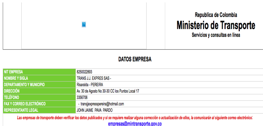
Imagen No. 3 información reportada en la pagina web del Ministerio de Transporte

en los IUIT, osea los días 14, 28 y 29 de noviembre de 2019, la empresa no contaba con la resolución de habilitación, toda vez que esta se encontraba cancelada desde el 21 de junio de 2019, lo que implica que prestó el servicio de transporte terrestre automotor especial, sin contar con la documentación que exige la norma de transporte para la prestación del servicio, esto es la Resolución que habilita a la empresa para que desarrolle la actividad transportadora. Para ampliar lo anterior, observemos lo siguiente: