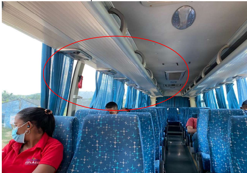
Imagen No. 3 del archivo denominado “Registro Fotográfico informe operativo, vehículo de placas Placa TVD197” 23

Imagen No. 2 del archivo denominado “Registro Fotográfico informe operativo, vehículo de placas Placa TVD197” 22