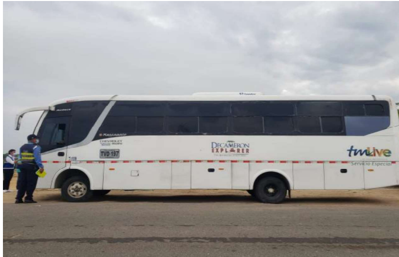
Imagen No. 2 del archivo denominado “Registro Fotográfico informe operativo, vehículo de placas Placa TVD197” 22

Imagen No. 1 del archivo denominado “Registro Fotográfico informe operativo, vehículo de placas Placa TVD197” 21