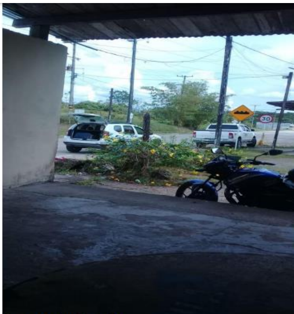
Sector Bomba de Cabi

Imagen No.8. Radicado Supertransporte No. 20205321472872 del 23 de diciembre de 2020.