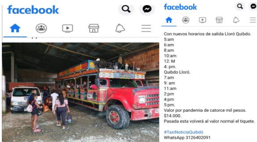
Imagen No.7. Radicado Supertransporte No. 20205321472872 del 23 de diciembre de 2020.

“(...) La presente imagen corresponde a la calle 27 entre carrera cuarta y Quinta de Quibdó, este sitio es un “parqueadero” conocido por toda la comunidad, en este sitio coligen vehículos de Transporte Especial, Mixto, taxis, que, sin ningún control, realizan prestación de servicio de transporte a diferentes destinos Del Departamento del chocó. → Se observa de nuevo la publicidad del renombrado “#Taxi Noticias Quibdó” en color azul, se observa un numero celular como referencia de contacto el número WhatsApp “3126402091”, todo eso sería supuestamente con permisividad absoluta de la Secretaria de Movilidad de Quibdó, este parqueadero, como se observa en la imagen tiene horarios de despachos, valor del pasaje al Municipio de Lloró, el cual es uno de los tantos destinos que podrían estarse gestando desde ese sitio (...)”.