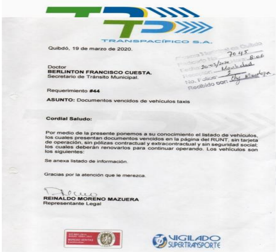
Imagen No. 2. Anexo Radicado Supertransporte No. 20205321048472 del 26 de octubre de 2020. Listado vehículos dirigido a la Investigada.