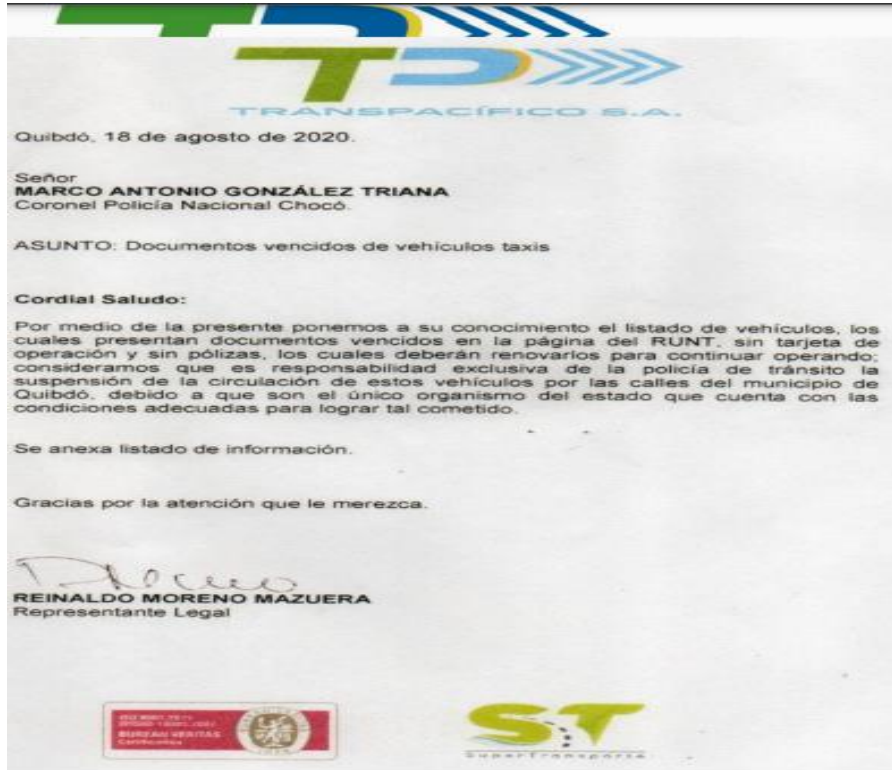
Imagen No. 6. Anexo Radicado Supertransporte No. 20205321048472 del 26 de octubre de 2020. Listado vehículos dirigido al Coronel Policía Nacional Chocó.