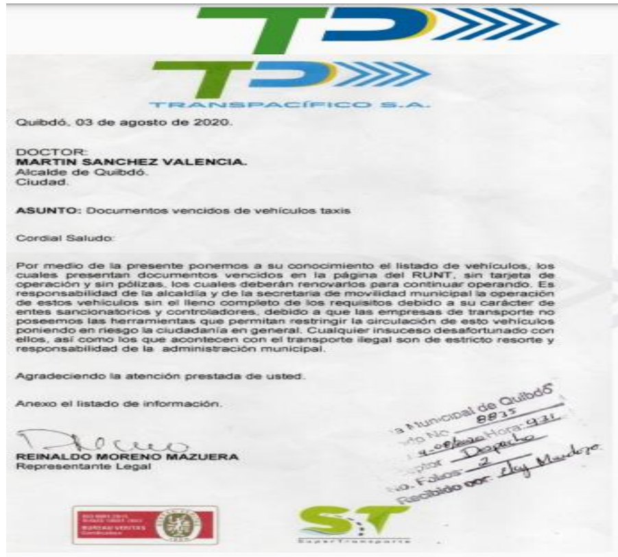
Imagen No. 4. Anexo Radicado Supertransporte No. 20205321048472 del 26 de octubre de 2020. Listado vehículos dirigido al Alcalde de Quibdó.