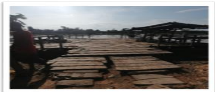
Ilustración 59. Embarcadero El Toro Planchón el Rey

En este corregimiento operan de manera informal dos planchones, los cuales trasladan vehículos y pasajeros desde el corregimiento del Toro hasta la otra orilla a la vereda Mazamorra. Los dos (2) Planchones tienen sus puntos de embarque y desembarque a una distancia de veinte (20) metros aproximadamente, precisando que en ninguna de las dos (2) orillas se observa infraestructura, toda vez que los planchones atracan en terraplenes ayudados con estructuras hechas en tablas y son amarrados en estacas fijadas a la tierra.