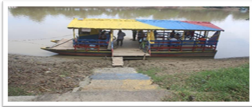
Ilustración 20. Embarcadero planchón el colombiano - margen derecha