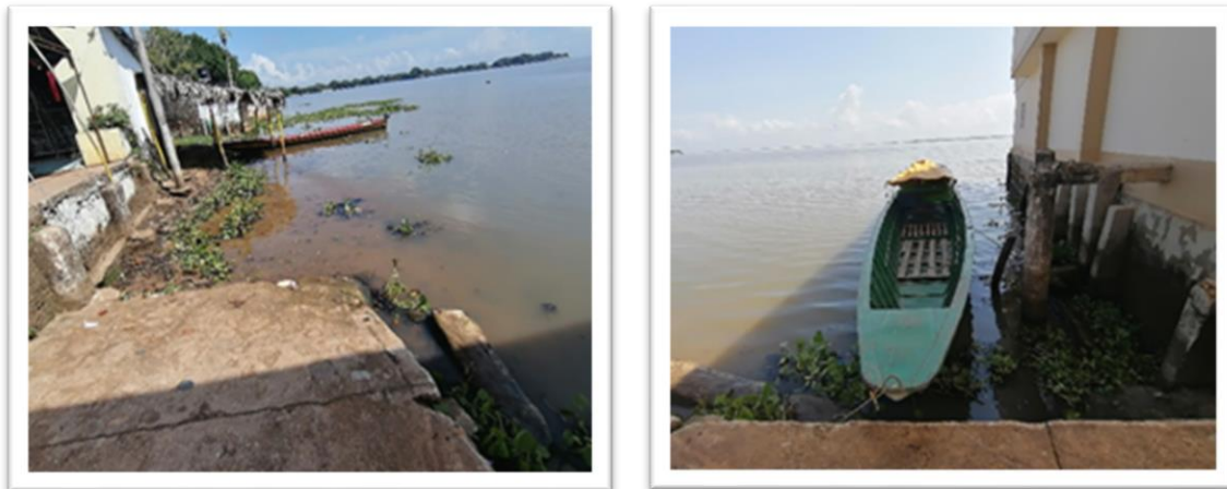
Ilustración 48. Embarcadero Puerto el Castillo

Este embarcadero es el lugar de embarque de tres empresas, las cuales no se encuentran habilitadas para prestar el servicio de transporte fluvial de pasajeros. Con respecto a su estructura, se trata de una rampa en concreto que se encuentra agrietada y cuyo pasamanos fue hurtado; el embarque de pasajeros se realiza mediante una tabla para ingresar a la embarcación.