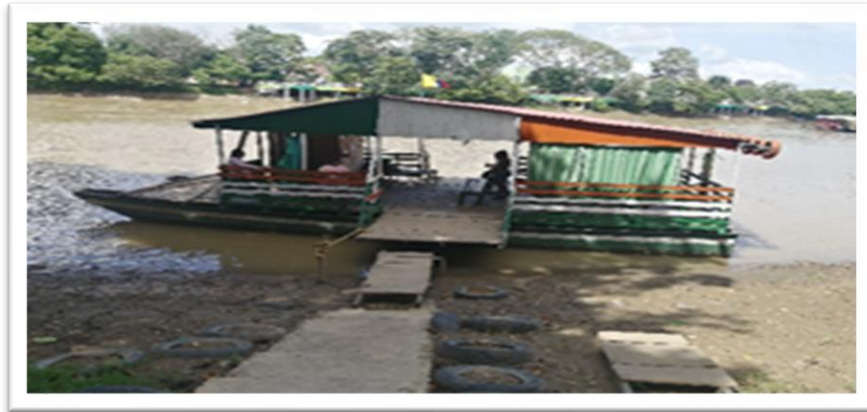
Ilustración 12. Embarcadero planchón la bala del Sinú - margen derecha