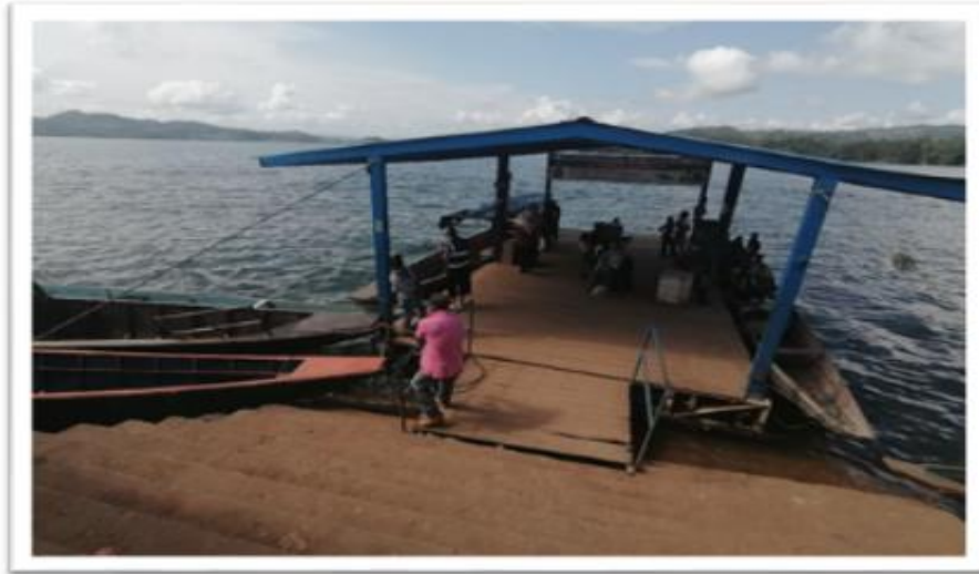
Ilustración 67. Muelle flotante Puerto Frasquillo

Con respecto a la infraestructura del muelle flotante, la misma está conformada por unas escaleras de concreto para acceder, cuyo ingreso es una pasarela con barandas hecha de tablonces de madera, al igual que todo el piso del muelle, el cual tiene una cubierta tipo techo sostenida por seis columnas metálicas; las embarcaciones se ubican a los laterales del muelle para permitir el abordaje de los pasajeros.