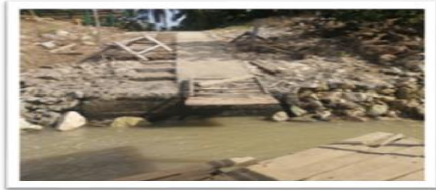
Ilustración 57. Embarcadero Puerto Salgar