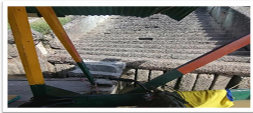
Ilustración 26. Embarcadero planchón la Bonga - margen derecha