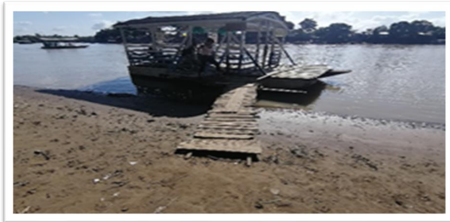
Ilustración 30. Barrio Rancho Grande - margen izquierdo