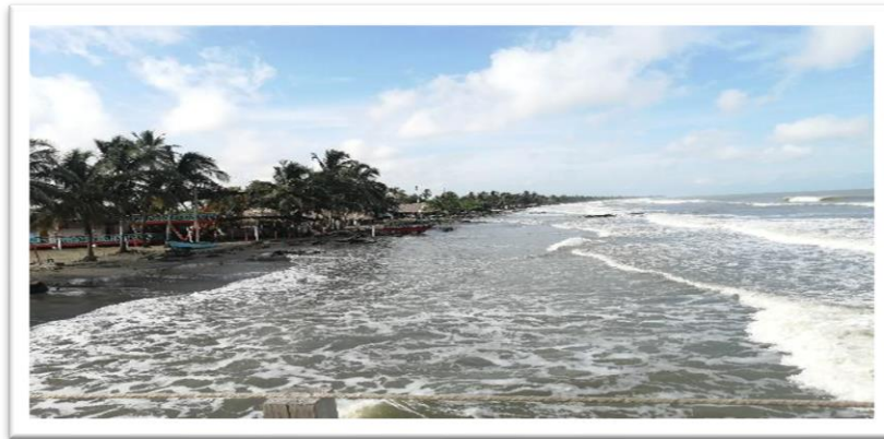
Ilustración 75 . Playa donde atracan las embarcaciones pesqueras que ocasionalmente prestan servicios de transporte.