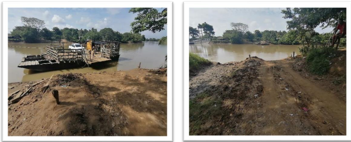
Ilustración 72. Embarcadero los Gómez - Cotorra

Con respecto a la infraestructura, se observaron terraplenes en las orillas y estacas enterradas en la tierra para amarrar las embarcaciones, referente a la embarcación empleada en el planchón para el desarrollo de actividades de transporte, se advirtió que no se encuentra habilitada, ni vinculada a ninguna empresa, ni cuenta con permiso de operación o autorización. También, se pudo observar que esta embarcación no cuenta con implementos mínimos de seguridad como extintor, chalecos salvavidas, botiquín y herramientas.