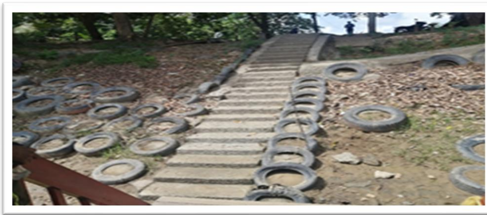
Ilustración 11. Embarcadero planchón estrella del Sinú - margen izquierda