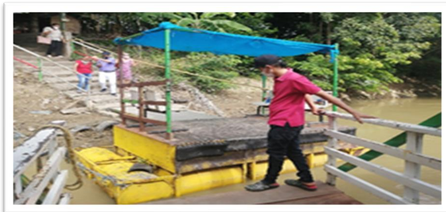
Ilustración 5. Embarcadero planchón la esmeralda - margen izquierda