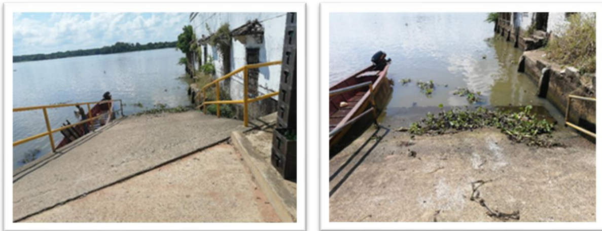
Ilustración 50. Embarcadero Puerto La Piladora Vieja

En este embarcadero se realizan actividades informales de transporte fluvial de carga, mediante embarcaciones manejadas por sus propietarios; con respecto a su estructura, la misma está conformada por una rampa en concreto, la cual cuenta con pasamanos a ambos lados.