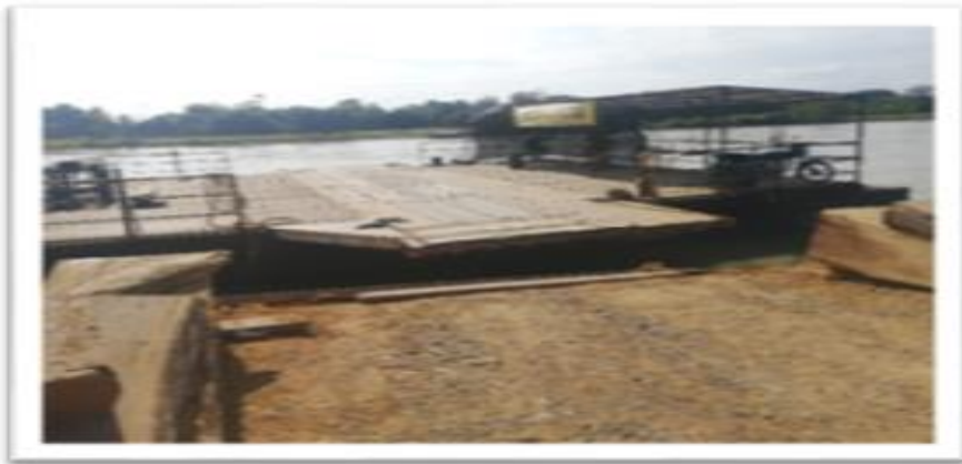
Ilustración 61. Embarcadero El Toro Planchón el Delirio