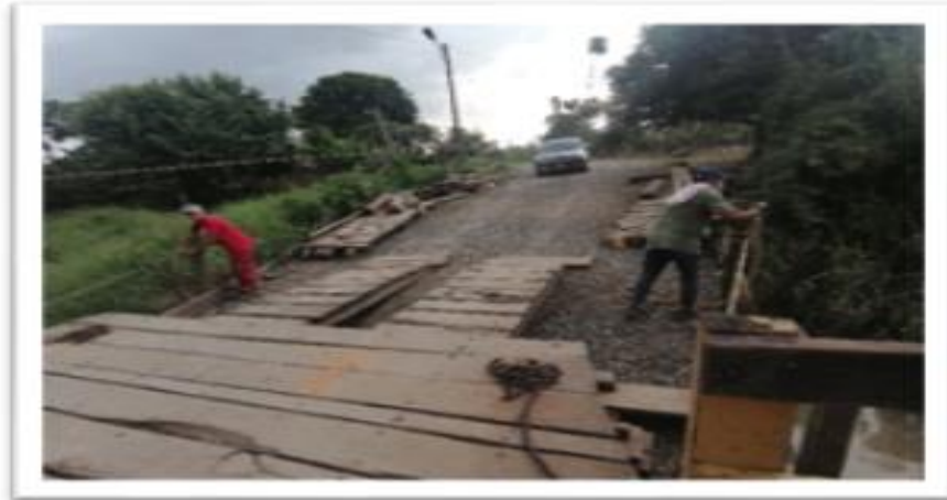
Ilustración 66. Embarcadero - Planchón Pasacaballos