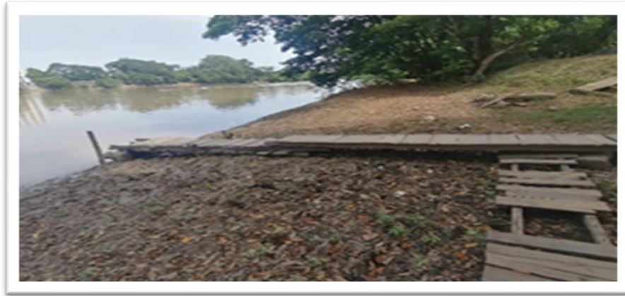
Ilustración 6. Embarcadero planchón la 26 - margen derecha

hacia la embarcación y estacas para el amarre de la misma; por otro lado, en la margen izquierda se observa un camino de escaleras en concreto, las cuales se prestan para acceder al terreno donde atraca la embarcación, sin embargo, no cuentan con pasamanos lo que constituye un riesgo para los usuarios que hacen uso de ellas.