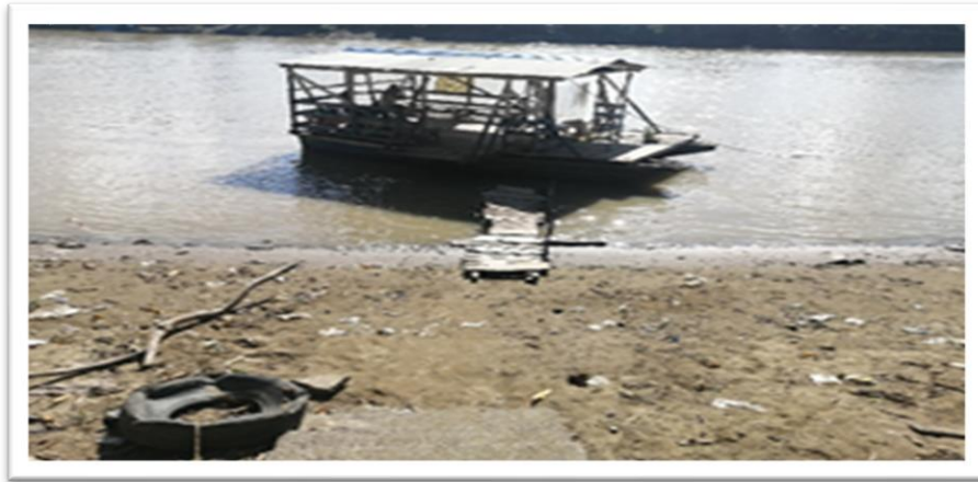
Ilustración 32. Barrio Rancho Grande - margen izquierdo