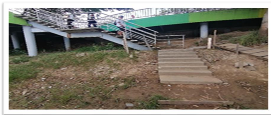
Ilustración 19. Embarcadero planchón los dos hermanos - margen izquierda.