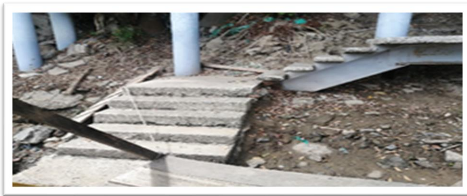
Ilustración 17. Embarcadero planchón el Canario - margen izquierda