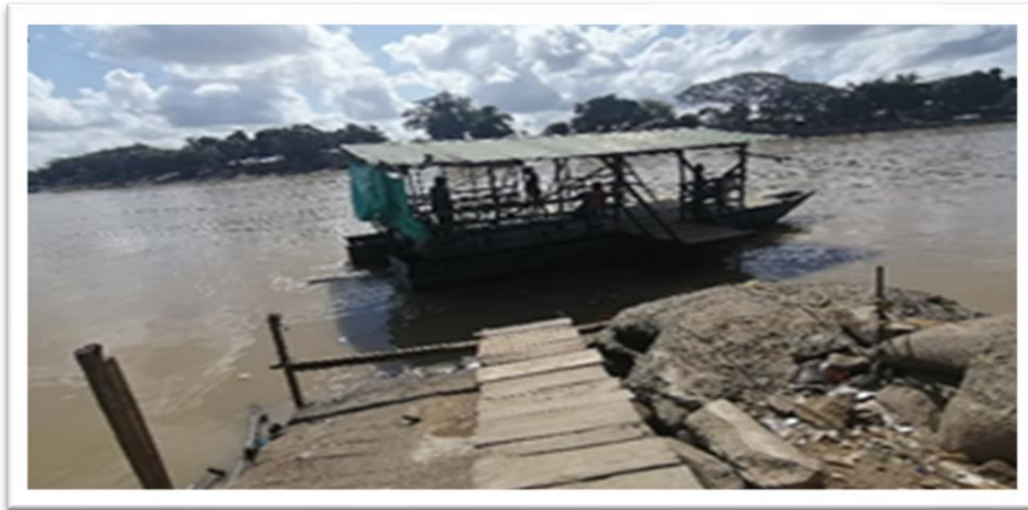
Ilustración 36. Barrio Rancho Grande - margen izquierdo