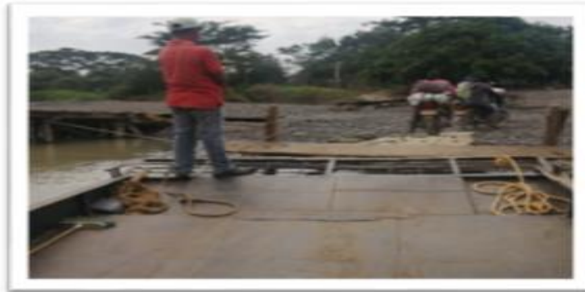
Ilustración 56. Embarcadero Lanchas Camellón Carrizola