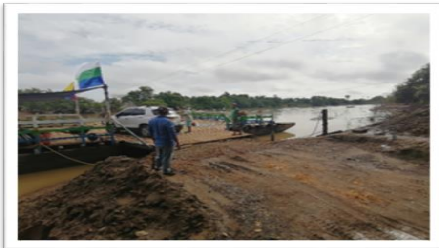
Ilustración 84. Embarcadero de Planchones - Barrio El Carmen Palo de Agua Ilustración