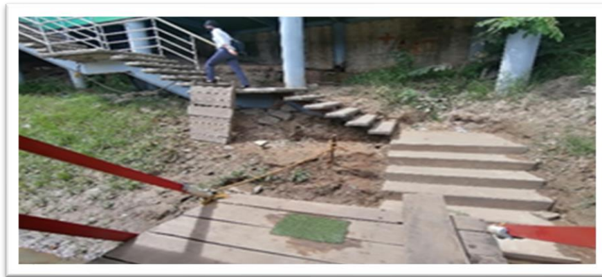
Ilustración 15. Embarcadero planchón la 33-1 - margen izquierda