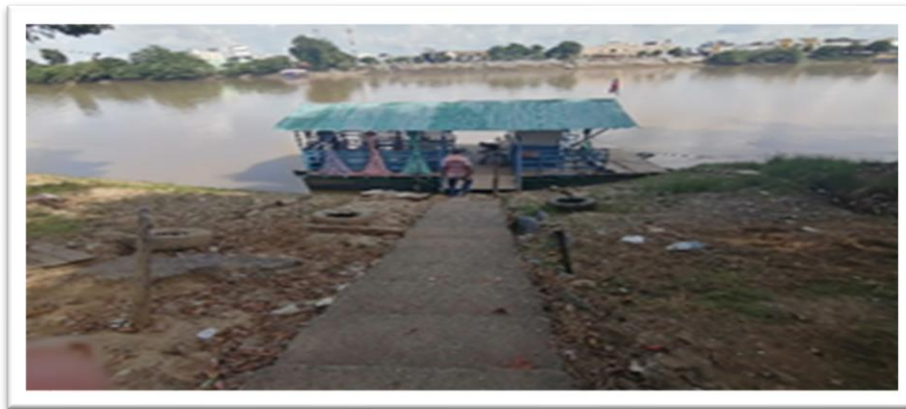
Ilustración 25. Embarcadero planchón Rey David - margen izquierda