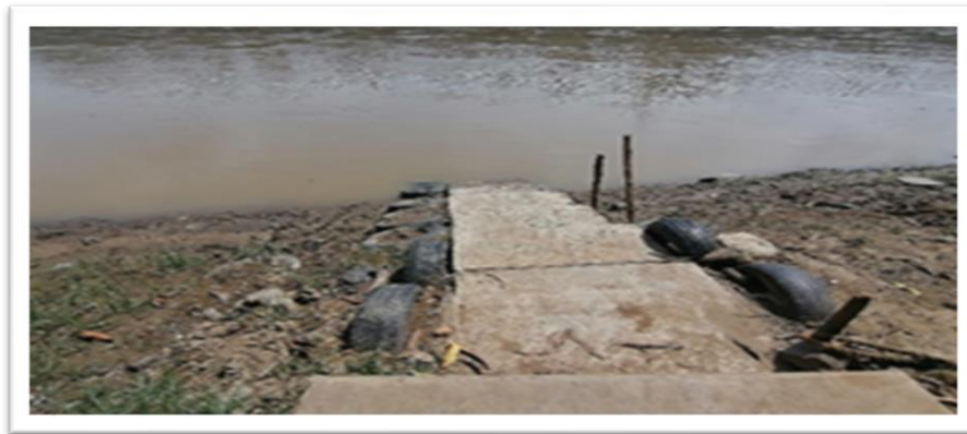
Ilustración 13. Embarcadero planchón la bala del Sinú - margen izquierda