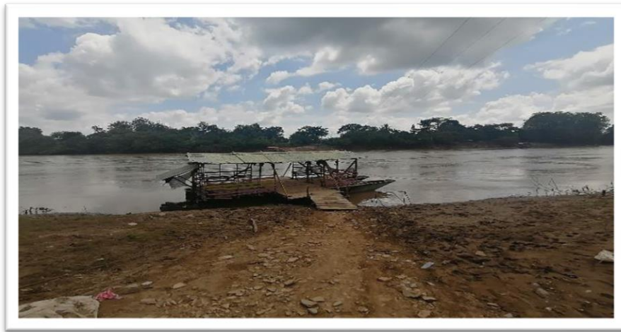
Ilustración 45. Embarcadero informal Boca de la Ceiba