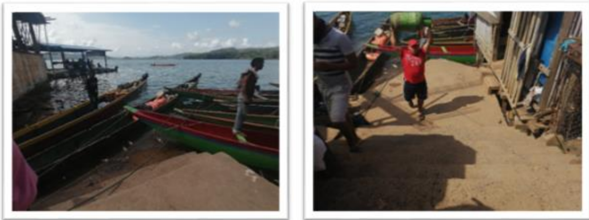
Ilustración 68. Embarcadero informal Puerto Frasquillo

El segundo punto de embarque en Puerto Frasquillo está constituido por unas escaleras de concreto, en el cual las embarcaciones son amarradas a estacas de maderas fijadas a la tierra y a las escaleras; en este punto sólo atracan las embarcaciones informales.