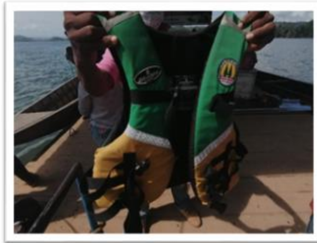
Ilustración 71. Chalecos salvavidas COOTRANSFLUALSINU

Durante la visita se observó que en el municipio de Tierralta se presta el servicio de transporte fluvial en condiciones de informalidad, con excepción de las embarcaciones de la empresa COOTRANSFLUALSINU, que opera en Puerto Frasuquillo. Las embarcaciones que operan de manera informal no portan elementos de seguridad.