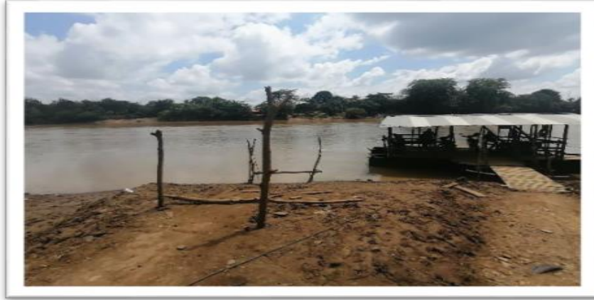
Ilustración 44. Embarcadero el Almirante - Corregimiento Boca de la Ceiba