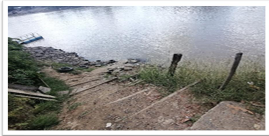
Ilustración 40. Barrio Betancí - margen izquierdo