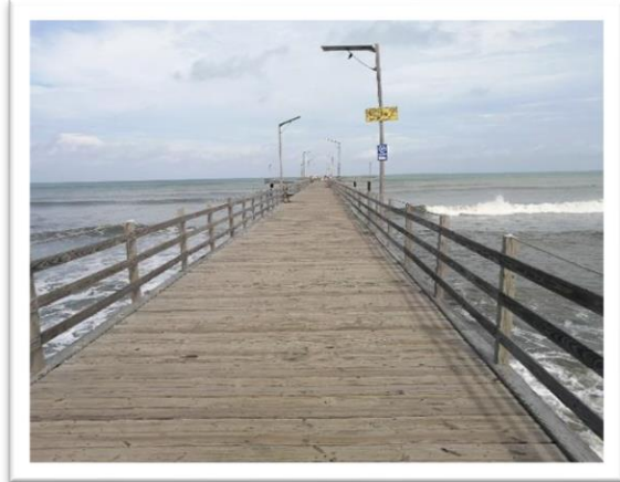
Ilustración 73. Muelle Turístico de Moñitos