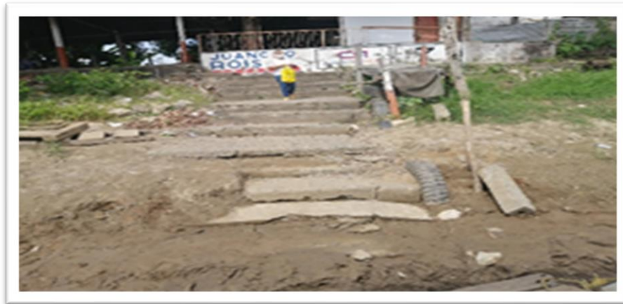
Ilustración 3. Embarcadero planchón villa nueva - margen izquierda.