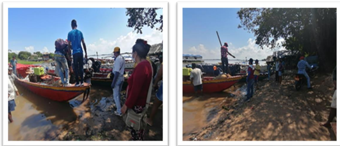
Ilustración 52. Embarcadero Puerto de la Ceiba

Este es el punto de desembarque y descargue de embarcaciones de las empresas informales; en este embarcadero no existe ningún tipo de infraestructura y las embarcaciones atracan en la orilla de la ciénaga.