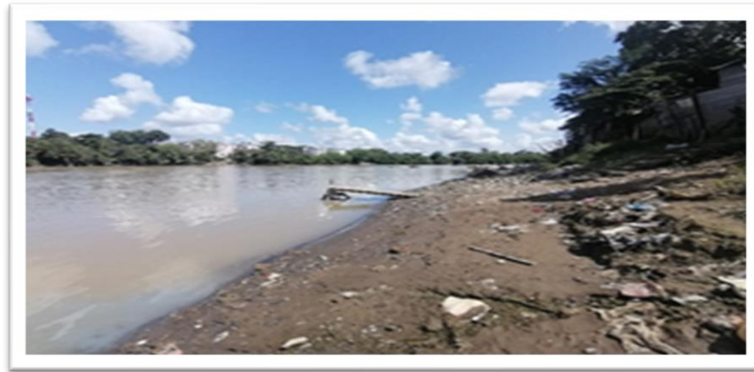
Ilustración 39. Barrio Santa Fe - margen derecho