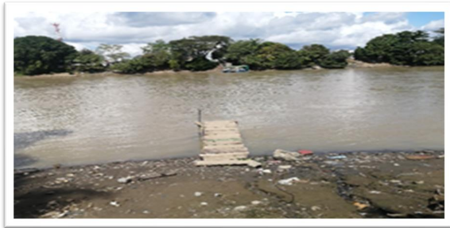
Ilustración 37. Barrio Santa Fe - margen derecho