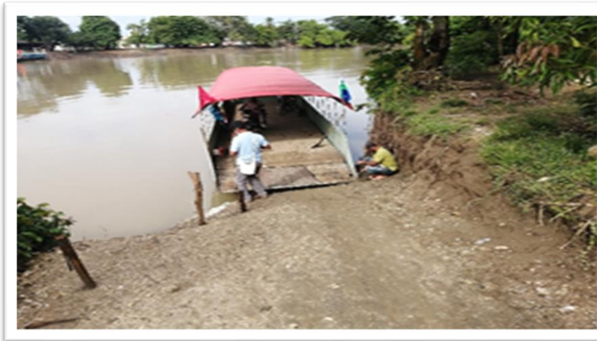
Ilustración 83. Embarcadero de lanchas - Barrio Antioquia Palo de Agua