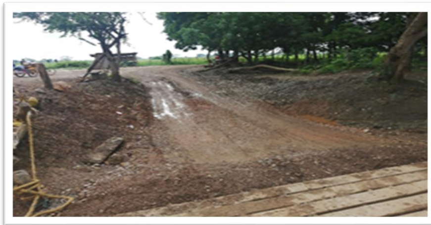
Ilustración 81. Embarcadero Planchón Asodecave - Cotocá Abajo