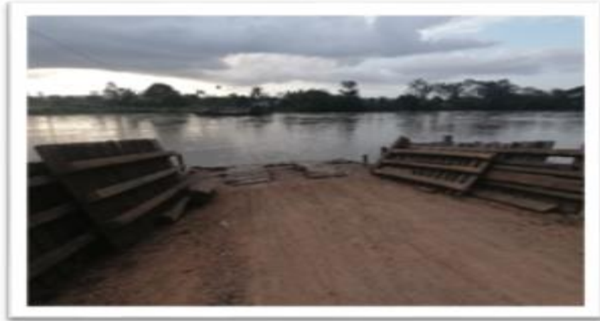
Ilustración 65. Embarcadero - Planchón el Paraíso