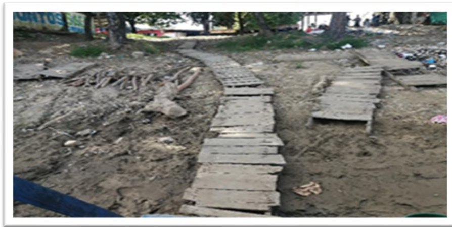
Ilustración 29. Embarcadero planchón el rebelde - margen izquierda