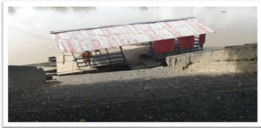
Ilustración 28. Embarcadero planchón el Rebelde - margen derecha