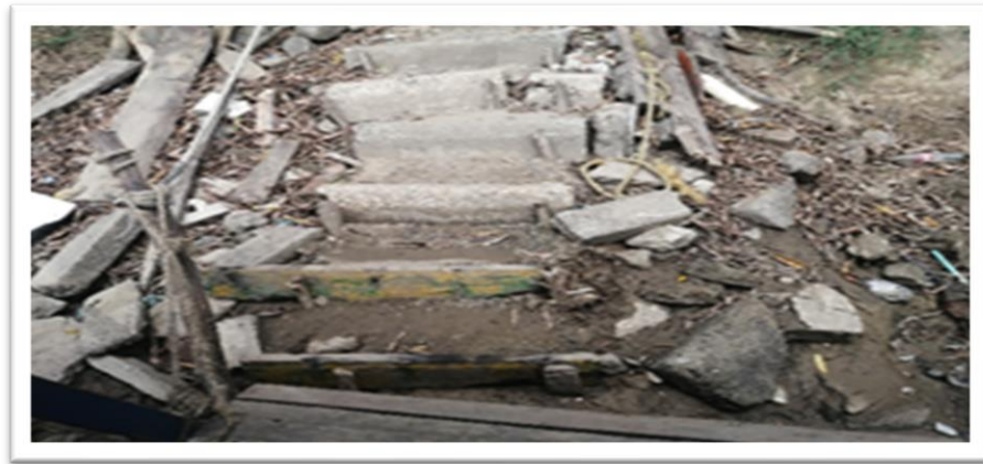
Ilustración 9. Embarcadero planchón el minuto de Dios - margen izquierda.