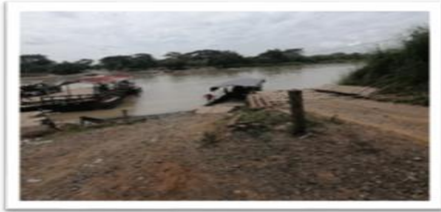
Ilustración 55. Embarcadero Lanchas Carrizola