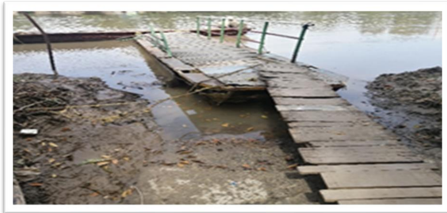
Ilustración 4. Embarcadero planchón la Esmeralda - margen derecha

Conforme a lo mencionado en ambas orillas del río se observa falta de infraestructura adecuada para la accesibilidad a personas con movilidad reducida.