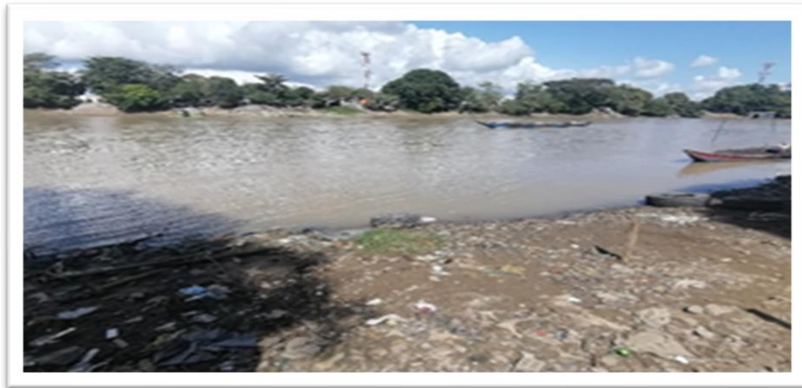
Ilustración 35. Barrio Santa Fe - margen derecho