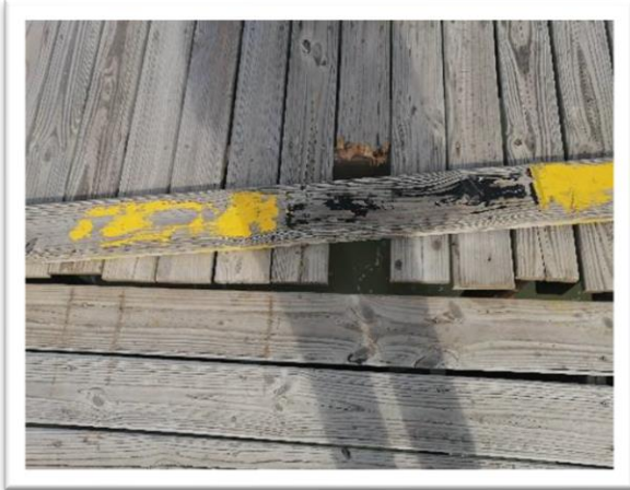
Ilustración 74. Áreas en mal estado del muelle de Moñitos