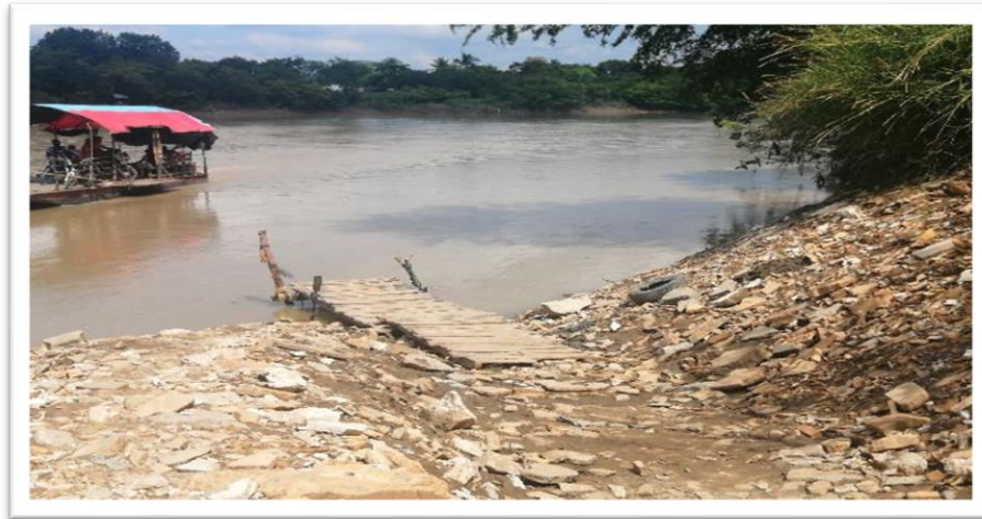
Ilustración 42. Embarcadero informal en el Corregimiento los Garzones