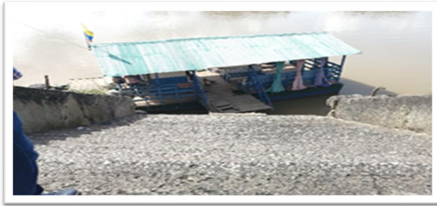
Ilustración 24. Embarcadero planchón Rey David - margen derecha