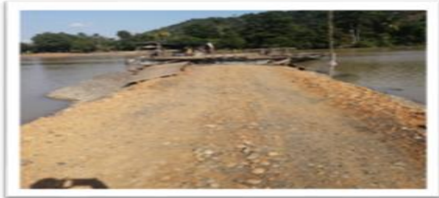
Ilustración 60. Embarcadero Mazamorra Planchón el Rey