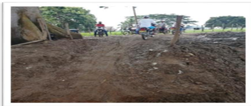
Ilustración 79. Embarcadero Cotocá Abajo - Acorazado del Sinú

En el lugar no existe infraestructura, únicamente se observan terraplenes en las orillas y estacas enterradas en la tierra para amarrar las embarcaciones, siendo necesario precisar que el terreno es irregular. Las embarcaciones que operan en el área se encuentran vinculadas a la empresa SOLUCIONES INTEGRALES SINÚ - NAVIERAS UNIDAS, la cual, de acuerdo a lo informado por el inspector fluvial, se encuentran realizando proceso de habilitación ante el Ministerio de Transporte.