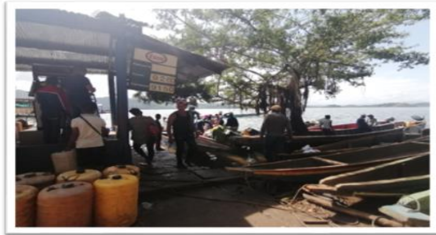
Ilustración 69 Embarcadero Estación de gasolina