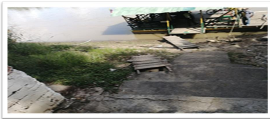
Ilustración 27. Embarcadero planchón la Bonga - margen izquierda