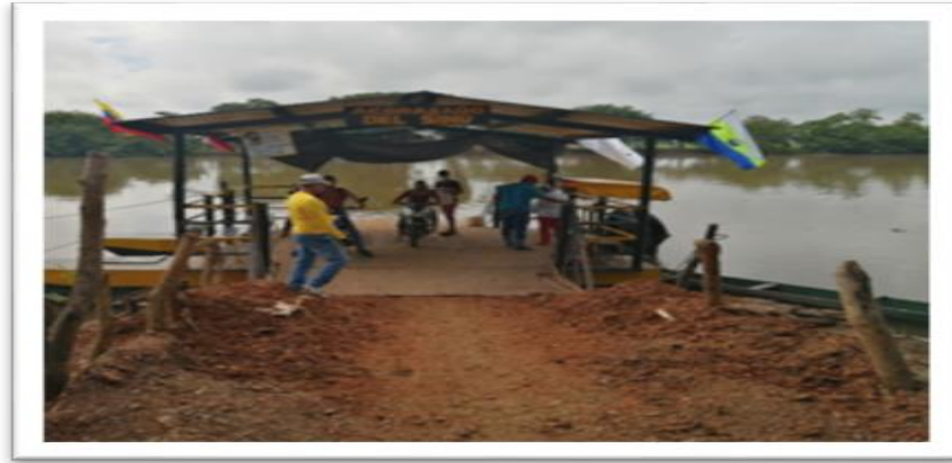
Ilustración 78 Embarcadero San Gabriel - Acorazado del Sinú