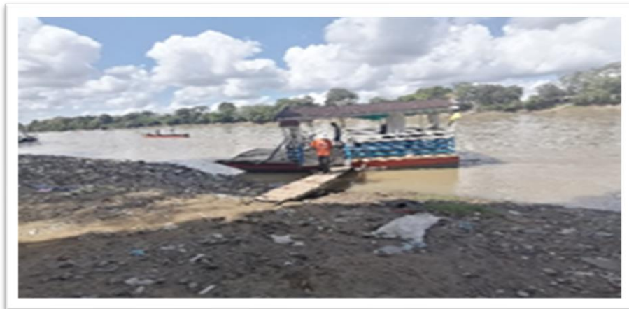
Ilustración 31. Barrio Saravanda - margen derecho