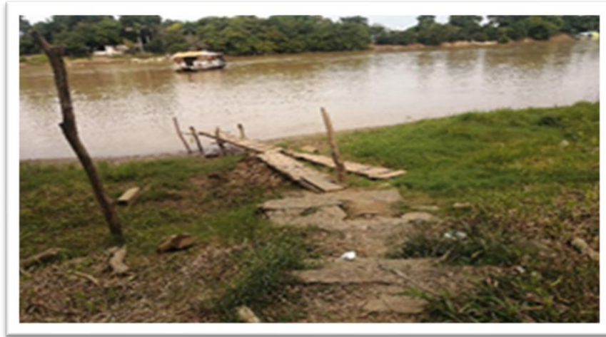
Ilustración 2. Embarcadero planchón villa nueva - margen derecha

El embarcadero en la margen derecha del río no posee infraestructura, se observan estructuras artesanales improvisadas en forma de plataformas de madera para permitir el paso de las personas hacia la embarcación y estacas para el amarre de la misma; así mismo, en la margen izquierda se observa un pequeño terraplén y unas escaleras en concreto, las cuales se prestan para acceder al terreno donde atracca la embarcación, sin embargo, se encuentran en un alto grado de deterioro, de manera que dificulta la accesibilidad a personas con movilidad reducida.