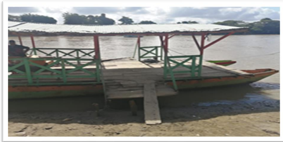
Ilustración 34. Barrio Rancho Grande - margen izquierdo