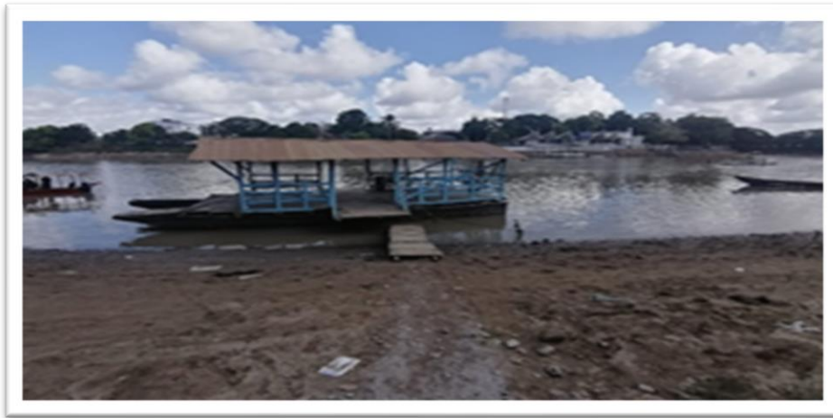
Ilustración 41. Barrio La Coquera - margen derecho