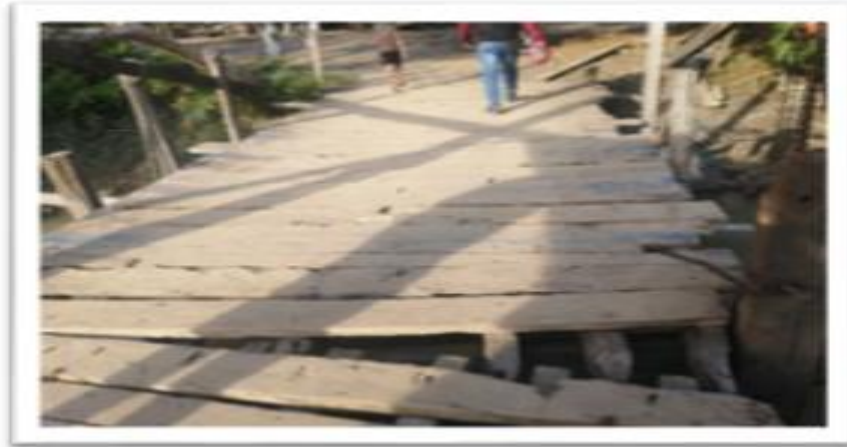
Ilustración 64. Embarcadero Nueva Platanera Planchón el Padrino