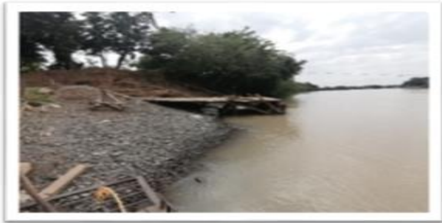
Ilustración 53. Embarcadero Planchones Carrizola

En todos los embarcaderos identificados se advirtió prestación del servicio en condiciones de informalidad, toda vez que ni las embarcaciones ni los tripulantes cuentan con documentación. Con respecto a la infraestructura, se identificó la existencia de estructuras de madera improvisadas de tablas tipo plataforma para que los vehículos y los usuarios pasen a través de ellas hacia la embarcación.