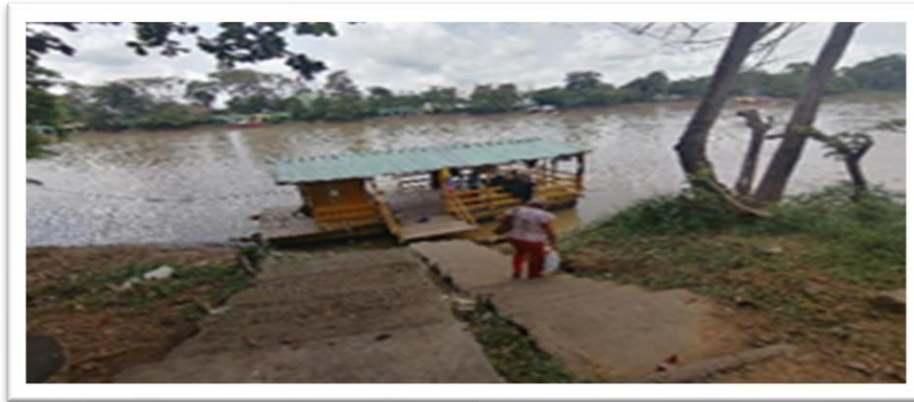
Ilustración 16. Embarcadero planchón el Canario - margen derecha