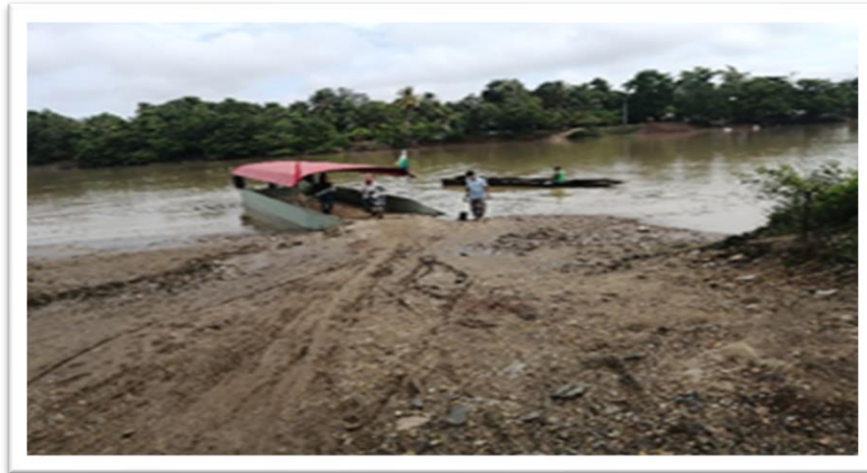
Ilustración 85. Embarcadero de lanchas -Barrio El Carmen Palo de Agua

En el municipio, aunque algunas embarcaciones cuentan con disponibilidad, no se evidenció uso de chalecos salvavidas, algunas de las embarcaciones cuentan con extintor vigente, chalecos salvavidas, botiquín, herramientas y cuentan con un sistema de drenado del agua de las canoas a través de motobomba; sin embargo, a pesar de portar los chalecos salvavidas, ni el tripulante ni los usuarios hacen uso de ellos.