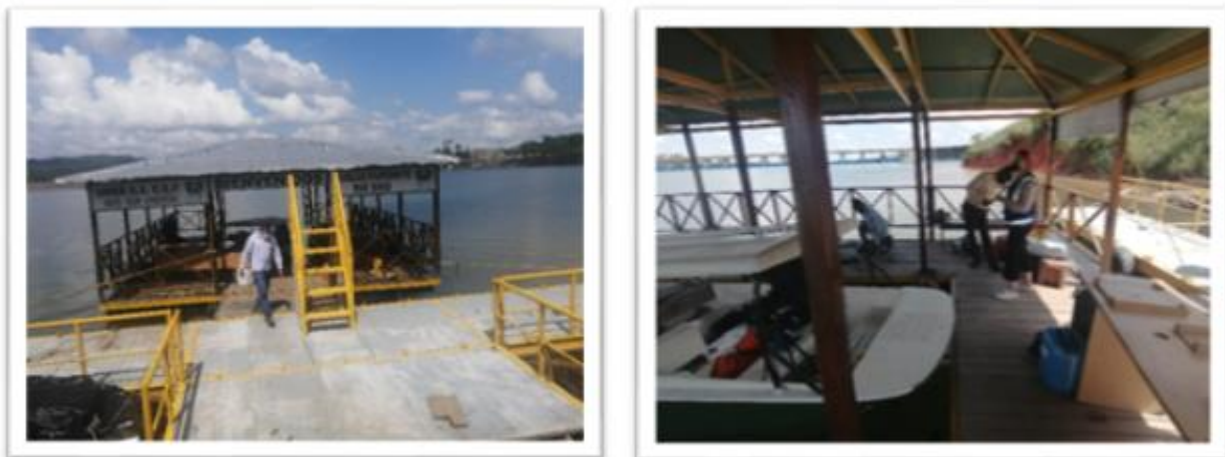
Ilustración 70 Muelle flotante Río Sinú - Muelle de Urrá

La infraestructura de este muelle consiste en una estructura de metal tipo plataforma para acceder al interior del muelle, el muelle tiene piso hecho en tablonces de madera, el cual se encuentra en muy buen estado y barandas metálicas que ayudan a minimizar el riesgo de caída; las embarcaciones ingresan por la parte central del muelle, lo que ayuda a que sea más fácil el abordaje de las mismas.