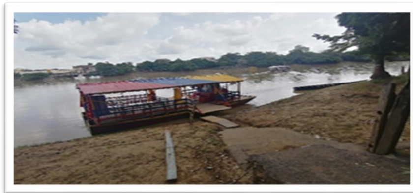
Ilustración 21. Embarcadero planchón el colombiano - margen izquierda.