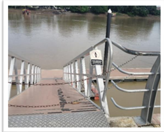
Ilustración 1 Muelle Ecoturístico de Montería