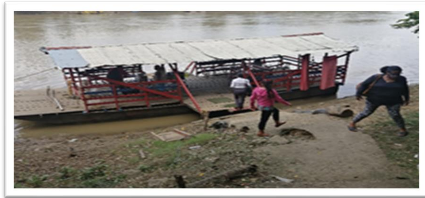
Ilustración 14. Embarcadero planchón la 33-1 - margen derecha