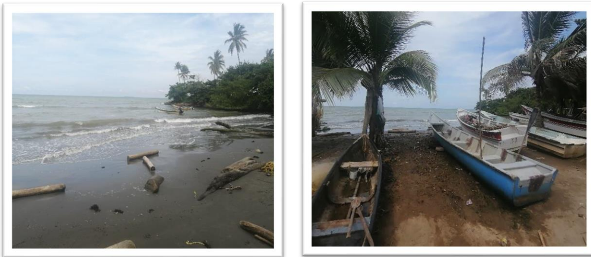
Ilustración 77. Playa Puerto Viejo

En esta área es donde se concentran la mayoría de las embarcaciones pesqueras que prestan de manera informal el servicio de transporte marítimo de pasajeros hacia Isla Tortuguilla.