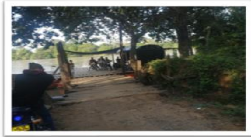
Ilustración 63. Embarcadero Isla Venezuela Planchón el Padrino

La infraestructura en ambos puntos está conformada por pasarelas de tablas sin barandas.