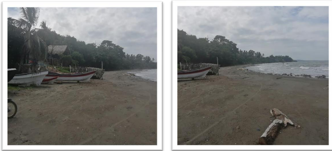
Ilustración 76. Playas del Bolívar