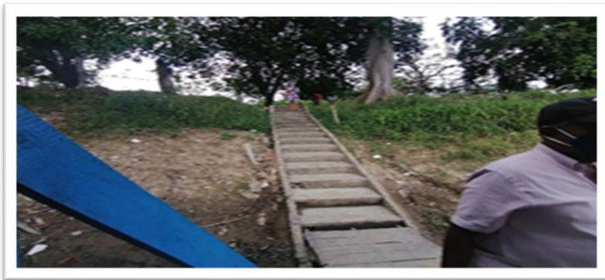
Ilustración 23. Embarcadero planchón Pompeya - margen izquierda