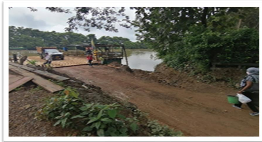
Ilustración 80. Embarcadero Planchón Asodecave - Casco Urbano Lorica