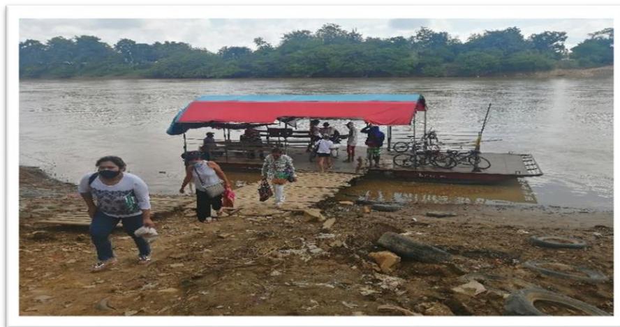
Ilustración 46. Embarcadero informal abriendo caminos - Corregimiento Boca de la Ceiba