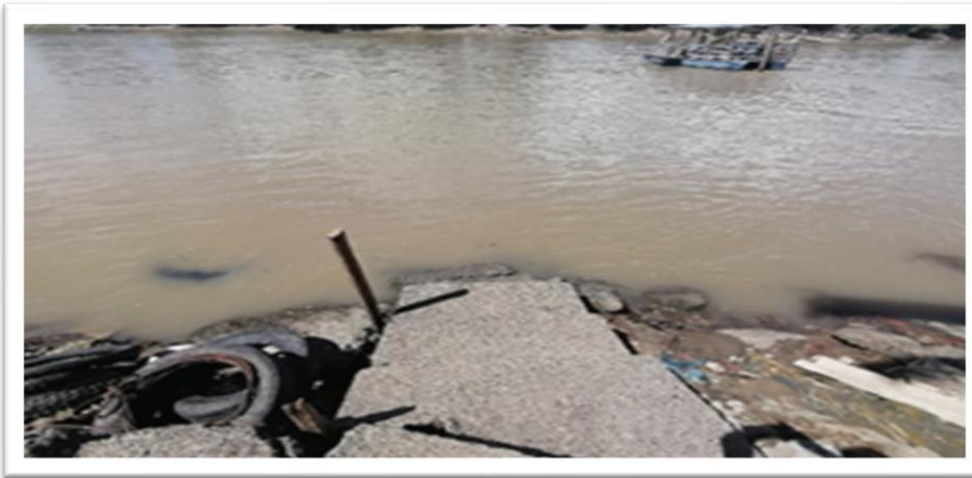
Ilustración 33. Barrio Saravanda - margen derecho