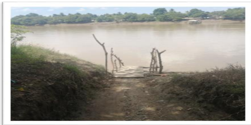
Ilustración 43. Embarcadero el Almirante