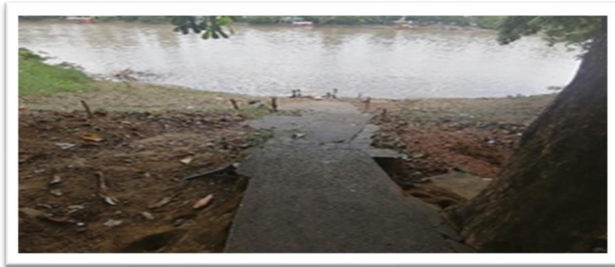
Ilustración 18. Embarcadero planchón los dos hermanos - margen derecha