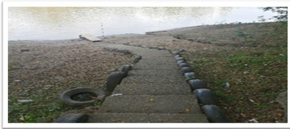
Ilustración 10. Embarcadero planchón estrella del Sinú - margen derecha