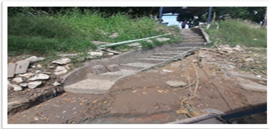
Ilustración 7. Embarcadero planchón la 26 - margen izquierdo