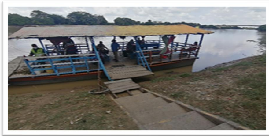
Ilustración 22. Embarcadero planchón Pompeya - margen derecha