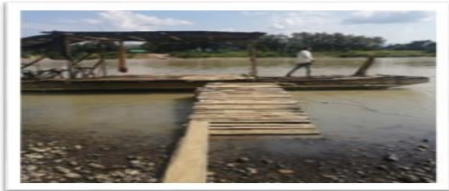
Ilustración 58. Embarcadero La Playa