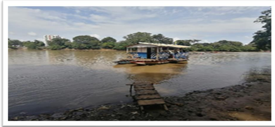
Ilustración 8. Embarcadero planchón el minuto de Dios - margen derecha