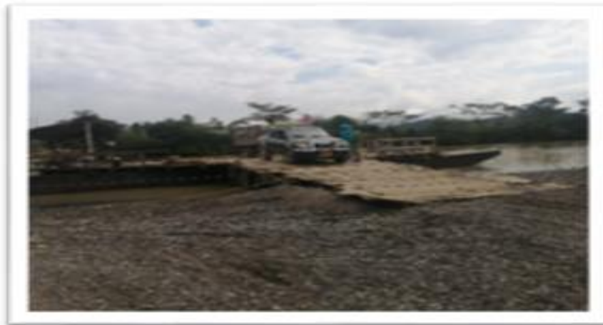
Ilustración 54. Embarcadero Planchones Camellón Carrizola