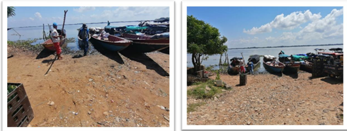
Ilustración 51. Embarcadero Puerto Cedro