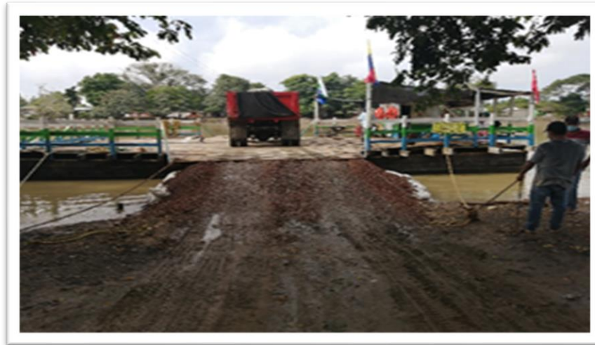
Ilustración 82. Embarcadero de Planchones - Barrio Antioquia Palo de Agua