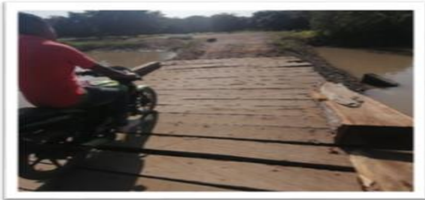
Ilustración 62. Embarcadero Mazamorra Planchón el Delirio