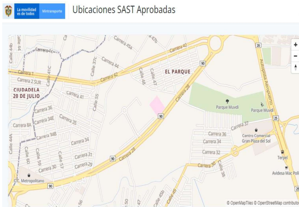
Imagen No. 3. Consulta ST realizada en el link https://fotodeteccion-app.ansv.gov.co/ubicaciones-aprobadas/?solicitud_departamento=22 , de los SAST autorizados para la detección de infracciones para el Instituto Municipal De Tránsito Y Transporte De Soledad. Punto No. 3. Ubicado en SIN DIRECCION autorizado el 26 de marzo de 2019.

Imagen No. 2. Consulta ST realizada en el link https://fotodeteccion-app.ansv.gov.co/ubicaciones-aprobadas/?solicitud_departamento=22 , de los SAST autorizados para la detección de infracciones para el Instituto Municipal De Tránsito Y Transporte De Soledad Punto No. 2. Ubicado en SIN DIRECCION autorizado el 26 de marzo de 2019.