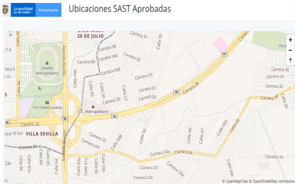
Imagen No. 4. Consulta ST realizada en el link https://fotodeteccion-app.ansv.gov.co/ubicaciones-aprobadas/?solicitud_departamento=22 , de los SAST autorizados para la detección de infracciones para el Instituto Municipal De Tránsito Y Transporte De Soledad, Punto No. 4. Ubicado en SIN DIRECCION autorizado el 26 de marzo de 2019.

Así, de acuerdo con la información pública que obra en la página del Ministerio de Transporte y de la Agencia Nacional de Seguridad Vial, le fueron autorizados al INSTITUTO MUNICIPAL DE TRÁNSITO Y TRANSPORTE DE SOLEDAD la puesta en marcha de los SAST que se relacionan a continuación: uno (1) el diez (10) de junio de dos mil diecinueve (2019) y tres (3) el 26 de marzo de dos mil diecinueve (2019).