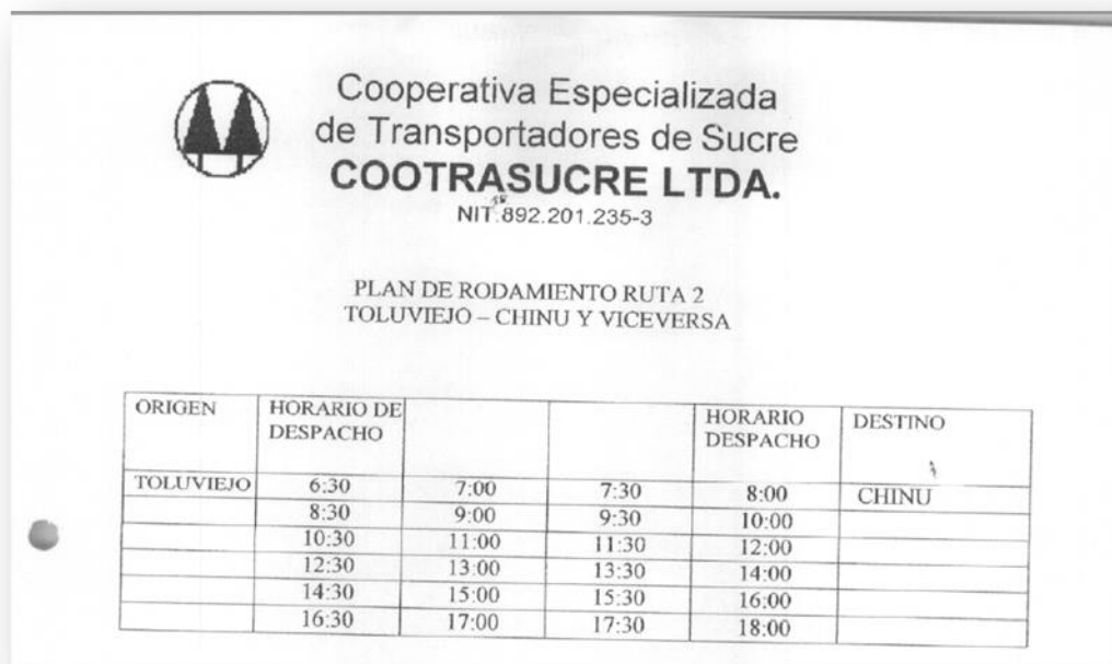
Imagen extraída del radicado de entrada 20205320233102.

Que el plan de rodamiento presentado a través del radicado de entrada 20205320233102, no se encuentra completo, por tal motivo al no describir las placas que cubren las rutas asignadas, no permitió a este Despacho conocer si efectivamente se están cumpliendo las rutas, horarios y frecuencias asignadas. Aunado a lo anterior, tampoco es posible determinar si existe una distribución racional y equitativa entre los diferentes vehículos vinculados COOTRASUCRE. Tal como se puede evidenciar en la siguiente muestra del plan de rodamiento de una de las rutas servida por la Cooperativa.