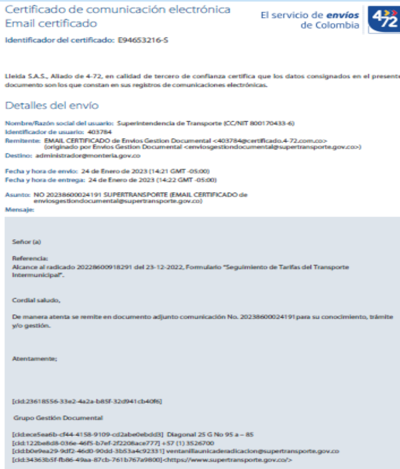
Imagen No. 4. Soporte de envío del Oficio de Salida No. 20238600024191 del 20 de enero de 2023.

Imagen No. 3. Soporte de envío del Oficio de Salida No. 20238600024191 del 20 de enero de 2023.