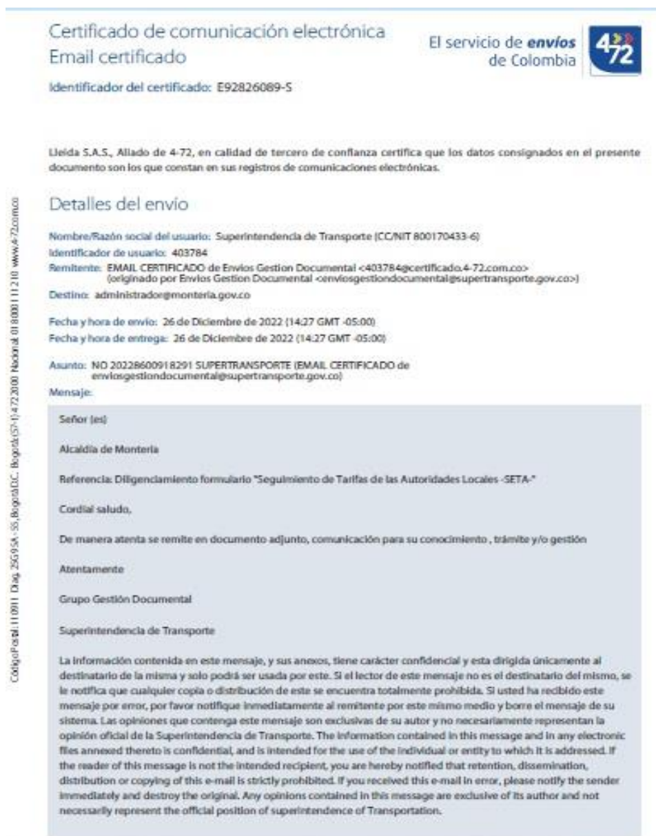
Imagen No. 1. Soporte de envío del Oficio de Salida No. 20228600918291 del 23 de diciembre de 2022.

Tal solicitud fue remitida a la Alcaldía de Montería el 26 de diciembre de 2022 y recibida por esa entidad en la misma fecha, según certificado de comunicación electrónica E92826089-S de Lleida S.A.S., aliado de 4 – 72. A continuación se presenta el referido certificado: