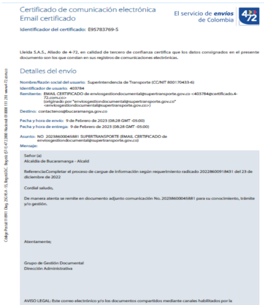
Imagen No. 4. Soporte de envío y de entrega del Oficio de Salida No. 20238600045881 del 8 de febrero de 2023.

Imagen No. 3. Soporte de envío y de entrega del Oficio de Salida No. 20238600045881 del 8 de febrero de 2023.