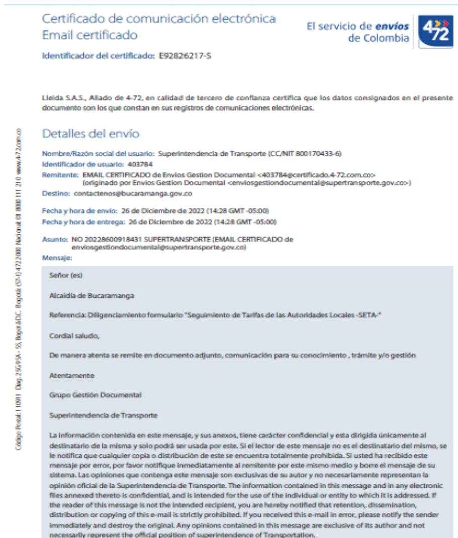
Imagen No. 1. Soporte de envío y de entrega del Oficio de Salida No. 20228600918431 del 23 de diciembre de 2022.

Tal solicitud fue remitida a la Alcaldía de Bucaramanga el 26 de diciembre de 2022 y recibida por esa entidad en la misma fecha, según certificado de comunicación electrónica E92826217-S de Lleida S.A.S., aliado de 4 – 72. A continuación se presenta el referido certificado: