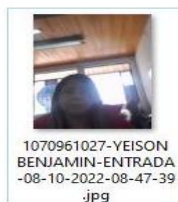
Imagen No. 1. Fotografía que fue tomada al aprendiz el día 8 de octubre de 2022, al iniciar la sesión de “ TEORÍA ” en el horario comprendido entre las 09:00 AM y las 11:00 AM 6 .

Igualmente, reportó lo hallazgos encontrados durante el desarrollo correspondiente al módulo “ PRÁCTICA ” llevado a cabo el día 16 de octubre de 2022, en el horario de 16:00 y las 18:00: “ (...) Se evidenció nuevamente que el CEA no realizó ”