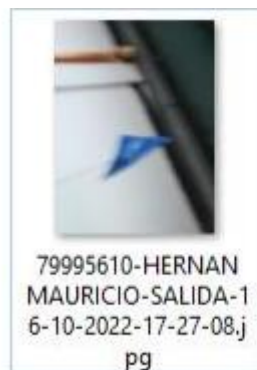
Imagen No. 2 Fotografía que fue tomada al aprendiz el día 16 de octubre de 2022, al salir de la sesión de “PRÁCTICA” en el horario comprendido entre las 16:00 y las 18:00 horas 7 .

En cuanto a la validación de la identidad del aprendiz a la salida de la sesión “PRÁCTICA” el Consortio para CEAS y CIAS aportó la siguiente imagen: