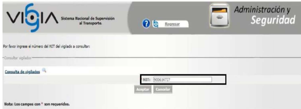
Imagen No. 1. Consulta ST realizada al link http://vigia.supertransporte.gov.co modulo vigilado de la identificación de la empresa en el aplicativo VIGIA Imagen

número de identificación tributaria (NIT) de la Investigada, tal como se muestra a continuación: