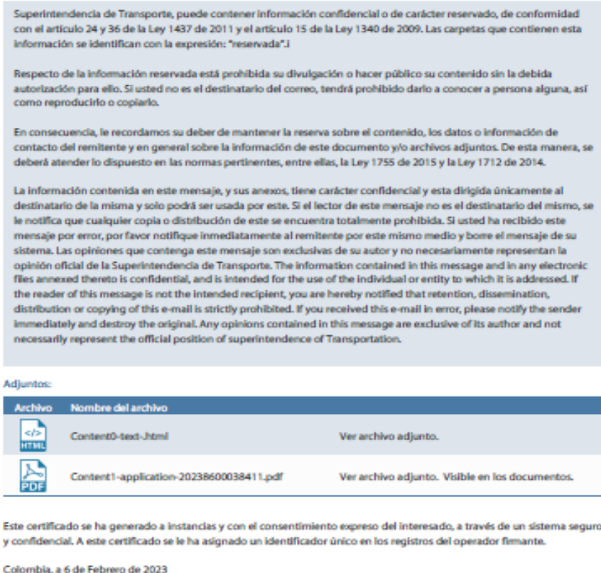
Imagen No. 4. Soporte de envío y de entrega del Oficio de Salida No. 20238600038411 del 2 de febrero de 2023.

Codigo Postal 110911 (Dpto. Putumayo) - 55 (Bogotá D.C.) - 472 2000 Nacional 01 8000 111 210 www.4-72.com.co