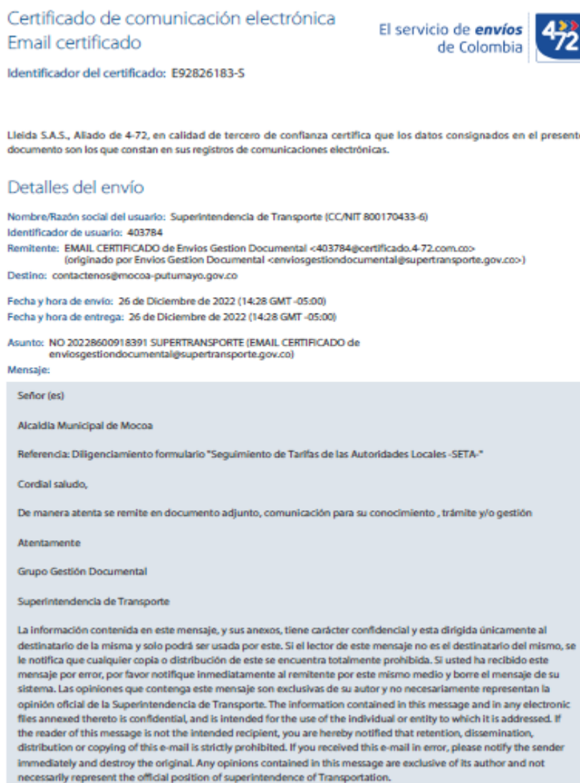
Imagen No. 1. Soporte de envío y de entrega del Oficio de Salida No. 20228600918391 del 23 de diciembre de 2022.

Tal solicitud fue remitida a la Alcaldía de Mocoa el 26 de diciembre de 2022 y recibida por esa entidad en la misma fecha, según certificado de comunicación electrónica E92826183-S de Lleida S.A.S., aliado de 4 – 72. A continuación se presenta el referido certificado: