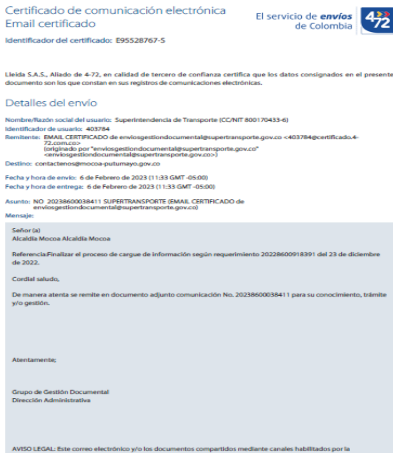
Imagen No. 3. Soporte de envío y de entrega del Oficio de Salida No. 20238600038411 del 2 de febrero de 2023.

Codigo Postal 110911 (Dpto. Putumayo) - 55 (Bogotá D.C.) - 472 2000 Nacional 01 8000 111 210 www.4-72.com.co