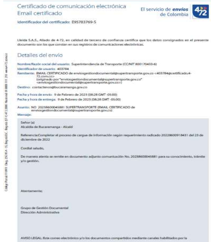
Imagen No. 4. Soporte de envío y de entrega del Oficio de Salida No. 20238600045881 del 8 de febrero de 2023.

Imagen No. 3. Soporte de envío y de entrega del Oficio de Salida No. 20238600045881 del 8 de febrero de 2023.