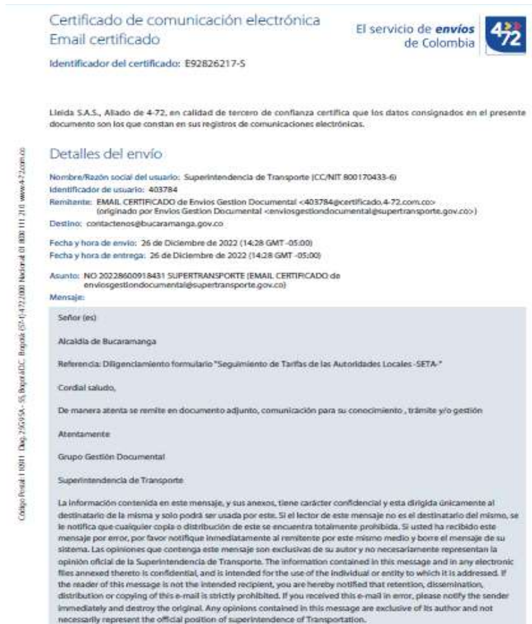
Imagen No. 1. Soporte de envío y de entrega del Oficio de Salida No. 20228600918431 del 23 de diciembre de 2022.

Tal solicitud fue remitida a la Alcaldía de Bucaramanga el 26 de diciembre de 2022 y recibida por esa entidad en la misma fecha, según certificado de comunicación electrónica E92826217-S de Lleida S.A.S., aliado de 4 – 72. A continuación se presenta el referido certificado: