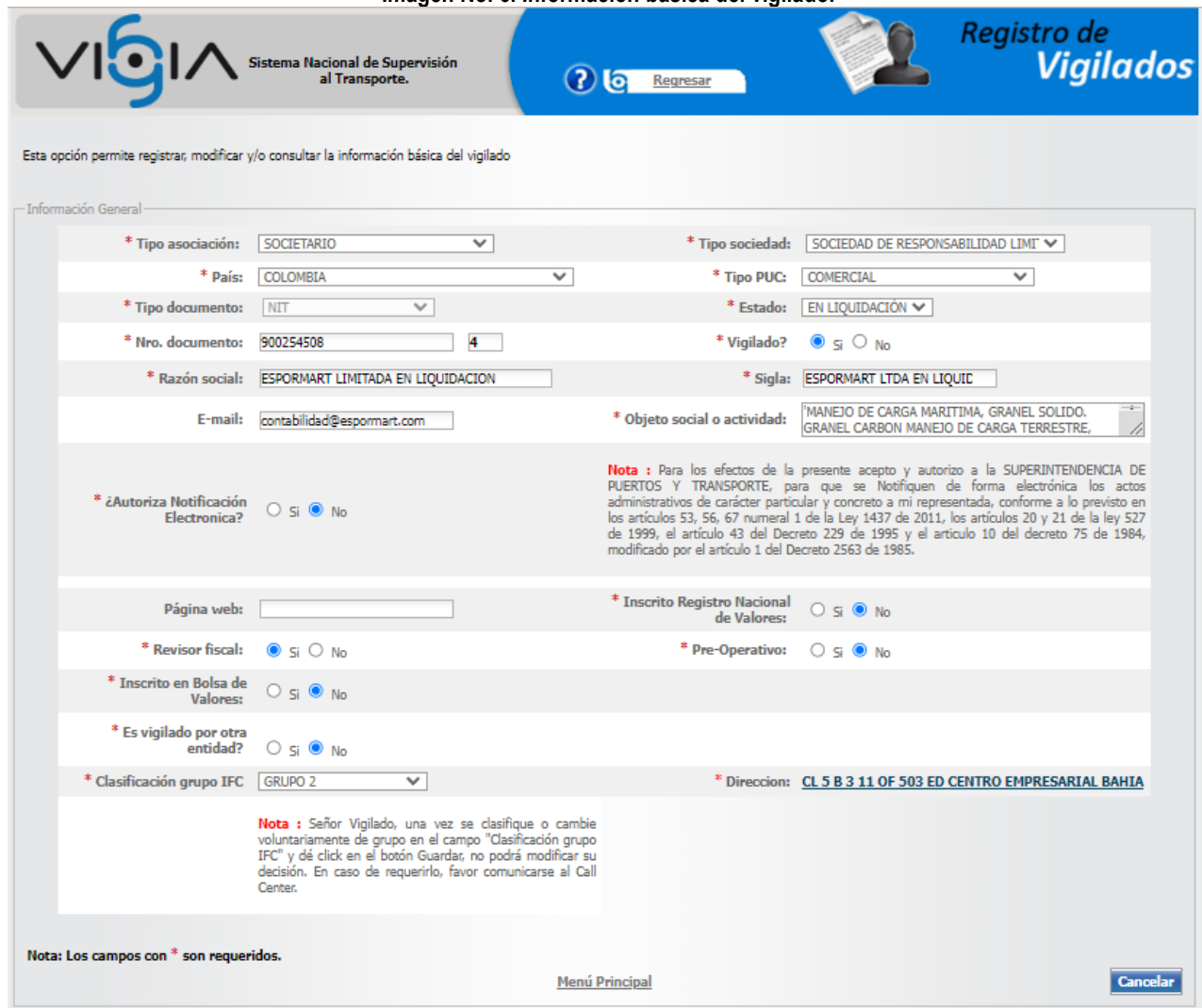
Imagen No. 6. Información básica del vigilado.