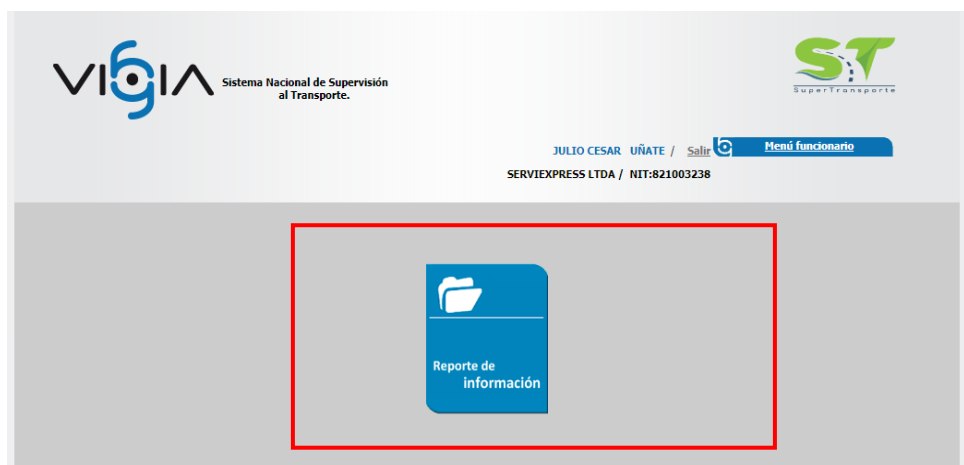
Imagen No. 7. Consulta ST realizada al link http://vigia.supertransporte.gov.co modulo vigilado de las entregas de control y seguimiento a las infracciones de tránsito de los conductores.

Realizada la consulta por parte de la Dirección de Investigaciones de Tránsito y Transporte se observó, que la Investigada no ha activado el módulo “Control Infracciones”, así, no se ha realizado la entrega durante los años 2017 (fecha en la que la Superintendencia informo de tal obligación) a la fecha 2022, lo anterior, permite evidenciar el incumplimiento de las obligaciones por parte de la empresa SERVIEXPRESS LTDA EN LIQUIDACION , como se evidencia a continuación: