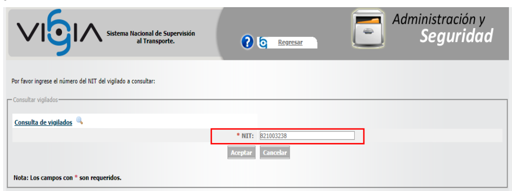
Imagen No. 6. Consulta ST realizada al link http://vigia.supertransporte.gov.co modulo vigilado de la identificación de la empresa en el aplicativo VIGIA

Dicho lo anterior, la Dirección de Investigaciones de Tránsito y Transporte consultó la plataforma VIGIA ingresando a través de la página web http://vigia.supertransporte.gov.co/ en el “Modulo vigilado”, utilizando el número de identificación tributaria (NIT) de la Investigada, tal como se muestra a continuación: