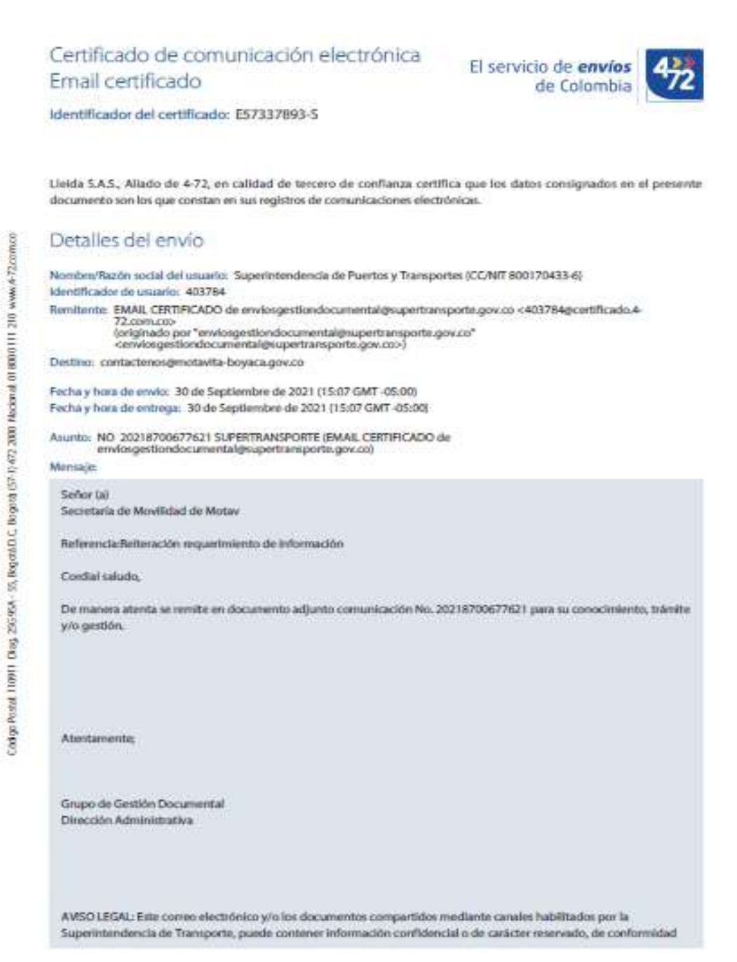
Imagen No. 2. Soporte de envío y de entrega del Oficio de Salida No. 20218700677621 del 27 de septiembre de 2021.

Frente a la reiteración del requerimiento se otorgó un término de tres (3) días hábiles para contestar, teniendo como fecha límite para dar respuesta el día 5 de octubre del 2021. Vencido el término otorgado, la Dirección efectuó la revisión al sistema de gestión documental de la Entidad en la que se evidenció que (i) dicho requerimiento fue remitido a la Investigada el día 30 de septiembre de 2021 19 y recibido por la SECRETARÍA DE MOVILIDAD DE MOTAVITA el mismo día 20 , y (ii) no se presentó ante esta Superintendencia respuesta alguna por parte de la Investigada. A continuación, se presenta el soporte de envío y entrega del referido requerimiento de información: