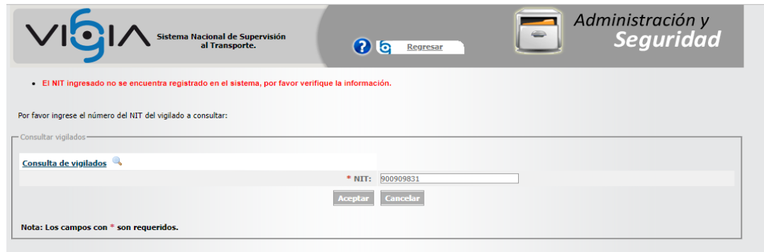
Imagen 4. Imagen tomada del Sistema Nacional de Supervisión al Transporte – VIGIA con fundamento en el NIT de la Unión Temporal RYM S.A.S.

RECUPERACIONES NARANJO RECYCLING S.A.S. con NIT. 806011019 – 0 y HAQ STEELS PVT S.A.S. con NIT 900.907.754-3 , para lo cual se encontró lo siguiente: