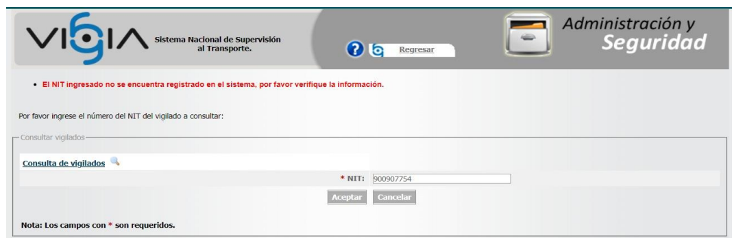
Imagen 5. Imagen tomada del Sistema Nacional de Supervisión al Transporte – VIGIA con fundamento en el NIT de la entidad HAQ STEELS PVT S.A.S.