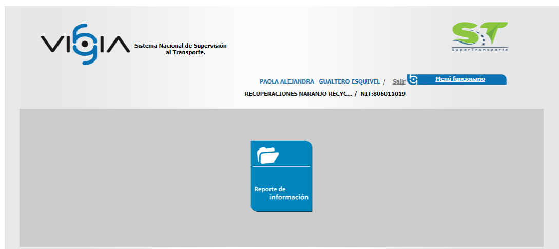
Imagen 6. Imagen tomada del Sistema Nacional de Supervisión al Transporte – VIGIA con fundamento en el NIT de la entidad RECUPERACIONES NARANJO RECYCLING S.A.S.

De lo anterior, se puede observar que, la sociedad UNIÓN TEMPORAL RYM S.A.S. , no se registró en el Sistema Nacional de Supervisión de Transporte – VIGIA, pese a conocer de la obligación que le asiste, pues, en certificación relacionada en la imagen 3 se indicó por parte del representante legal lo siguiente: "inmediatamente quede el registro como vigilado procederemos a justificar los reportes de información en el sistema" desconociendo que, desde