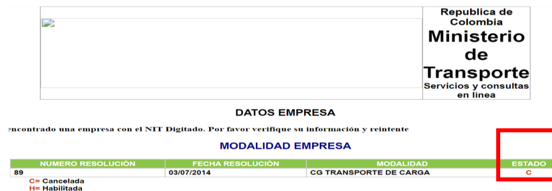
Imagen 4. Consulta habilitación página Ministerio de Transporte

7.3. Que, este Despacho consultó la página web del Ministerio de Transporte 11 con la finalidad de verificar si la empresa RAPIDO HUMADEA S.A.S cuenta con la habilitación debida para prestar el servicio público en la modalidad de carga, observando que lo siguiente: