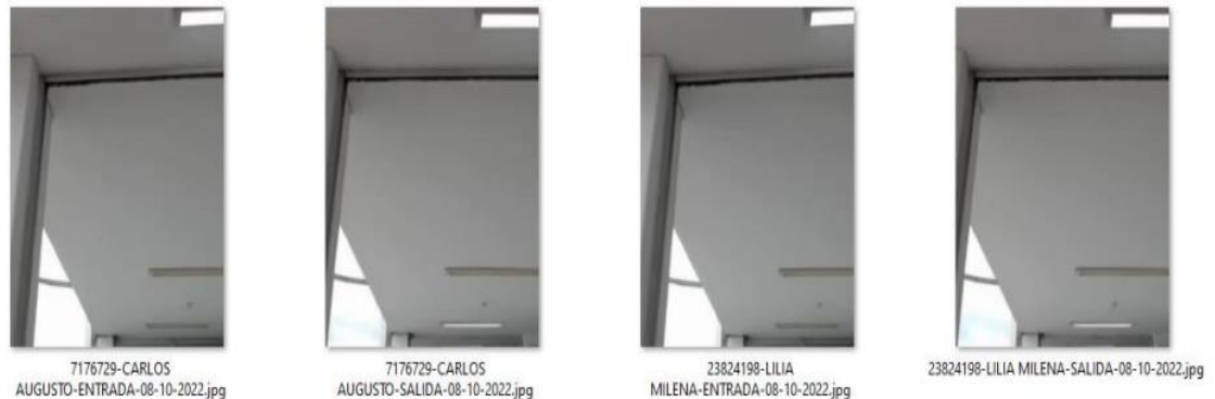
Imagen No. 2 Fotografía que fue tomada a los aprendices el día 8 de octubre de 2022, al entrar y salir de la sesión de “TEORÍA” en el horario comprendido entre las 08:00AM las 10:00 AM 7 .

Finalmente, reportó los hallazgos encontrados durante el desarrollo correspondiente al módulo “ TEORÍA ” llevado a cabo el día 01 de octubre de 2022, en el horario de 08:00 AM y las 10:0 AM “Se evidenció que el CEA no realizó correctamente el procedimiento de toma de registros fotográficos, ya para cuatro (4) aprendices la imagen almacenada en bases de datos corresponde a lo que aparentemente es un pasillo del establecimiento (...)” .