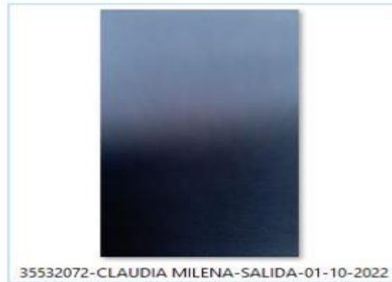
Imagen No. 2 Fotografía que fue tomada a la alumna el día 1 de octubre de 2022, a la salida de la sesión de “práctica” en el horario comprendido entre las 08:00AM las 10:00 AM 7 .

Así las cosas, el Consorcio para CEAS y CIAS concluyó lo siguiente; “Estas circunstancias representan un presunto uso indebido del sistema SICOV por parte del CEA, ya que no se está validando correctamente la identidad del instructor y de los aprendices que ingresan a las sesiones (...)”