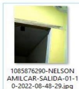
Imagen No. 1. Fotografía que fue tomada al aprendiz el día 01 de octubre de 2022, al finalizar la sesión de “ TEORÍA ” en el horario comprendido entre las 08:00 AM y las 09:00 AM 6 .

Sobre la validación de la identidad de los aprendices al iniciar y finalizar la sesión “ TEORÍA ” el Consortio para CEAS y CIAS aportó la siguiente imagen: