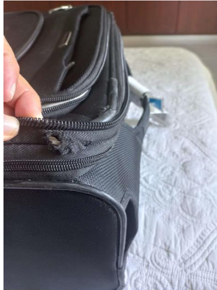
Imagen 3. Equipaje facturado Vuelo VE9044 del 11/01/2023.

Fuente: PQR 20235340069112 del 18 de enero de 2023. Pág. 4 17 .