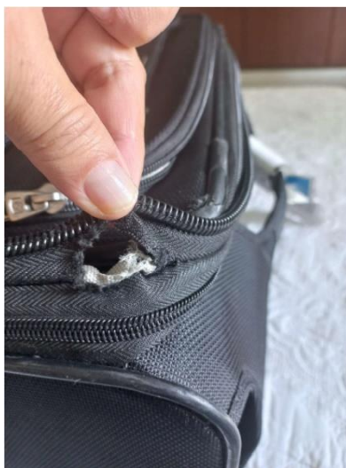
Imagen 2. Equipaje facturado Vuelo VE9044 del 11/01/2023.