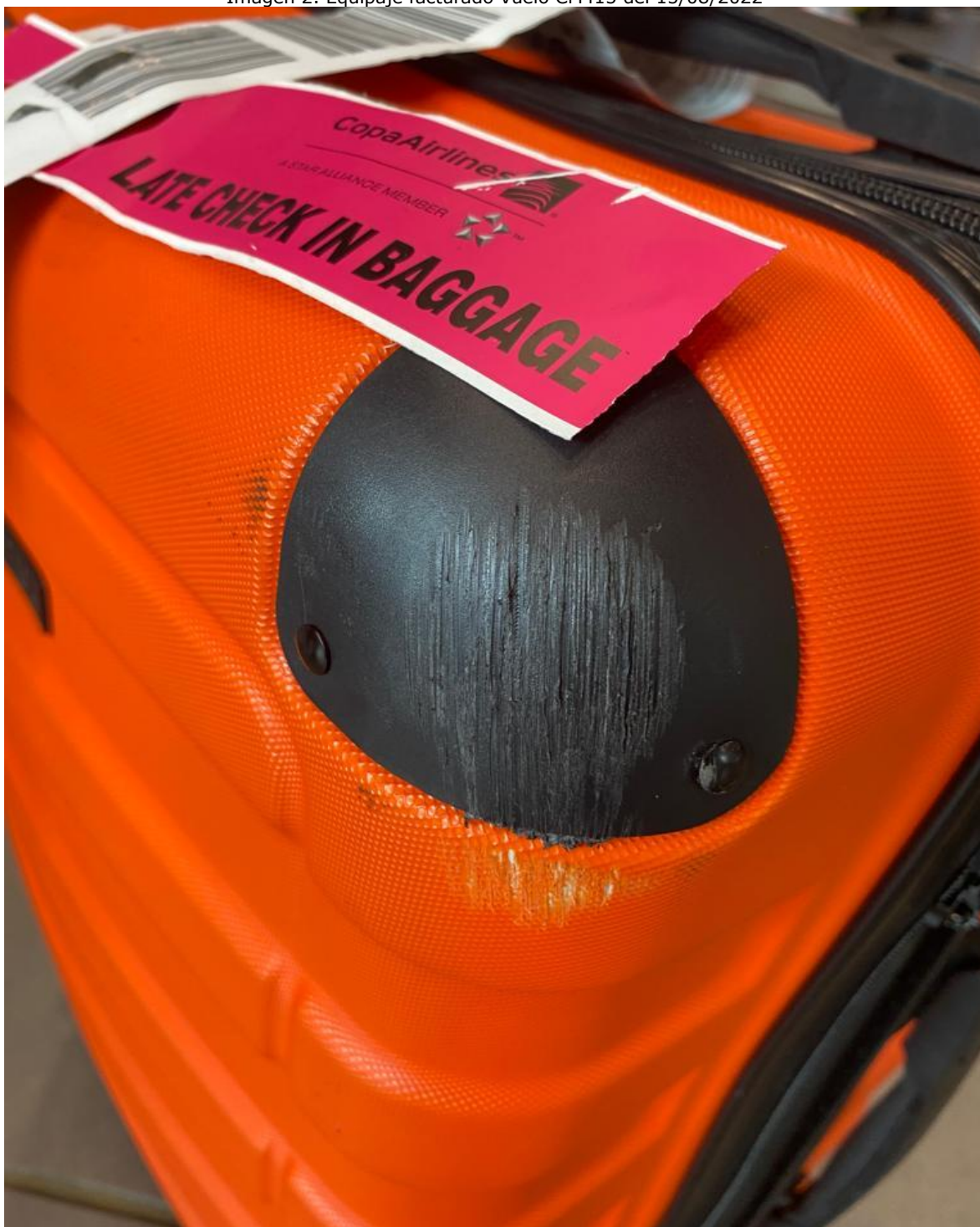
Imagen 2. Equipaje facturado Vuelo CM415 del 15/08/2022

16