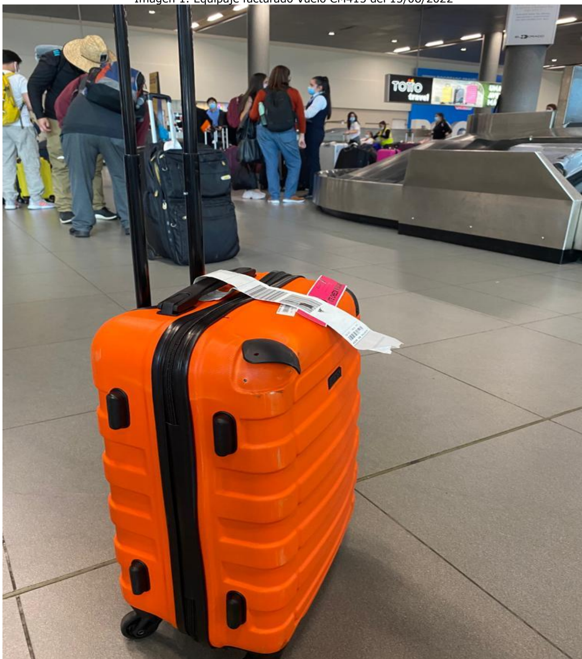
Imagen 1. Equipaje facturado Vuelo CM415 del 15/08/2022