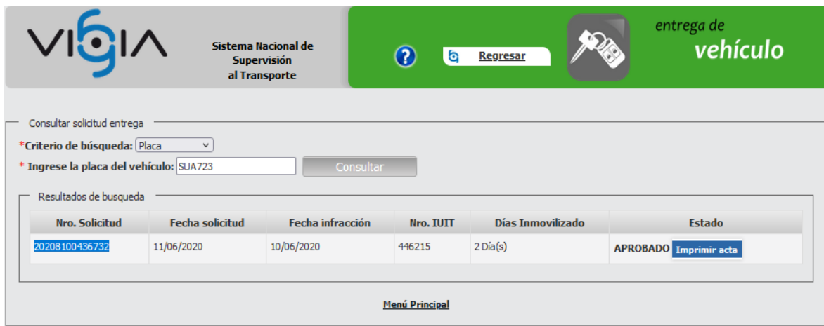
Imagen 4. Consulta ST realizada al link http://vigia.supertransporte.gov.co en el aplicativo VIGIA

17.1.2.1 Que, una vez analizado el precitado informe, este Despacho evidenció que, en la casilla 11 del IUIT, el agente identificó a la empresa Rápidos Umadra, como presunto infractor, hecho por el cual, con el fin de recopilar el material probatorio que permitiese identificar la empresa de servicio público de transporte de carga encargada de la operación, se procedió a verificar la plataforma VIGIA - sistema Nacional de Supervisión al Transporte- en el módulo de "consultas solicitud de inmovilizaciones", utilizando como criterio de búsqueda la placa SUA723, resultado el cual arrojó, una solicitud de salida de vehículo con radicado No. 20208100436732 del 11/06/2020, como se observa a continuación: