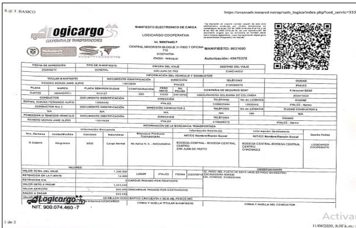
Imagen 5. Manifiesto Electrónico de Carga No. 8631680.

Es así que, esta Dirección de Investigaciones procedió a analizar la precitada solicitud, logrando establecer que (i) el IUIT que originó la inmovilización es el No. 446215 del 10/06/2020, es decir, el informe que nos ocupa para el caso en particular (ii) se aportó entre otros documentos, el Manifiesto Electrónico de Carga No. 8631680, como se muestra a continuación: