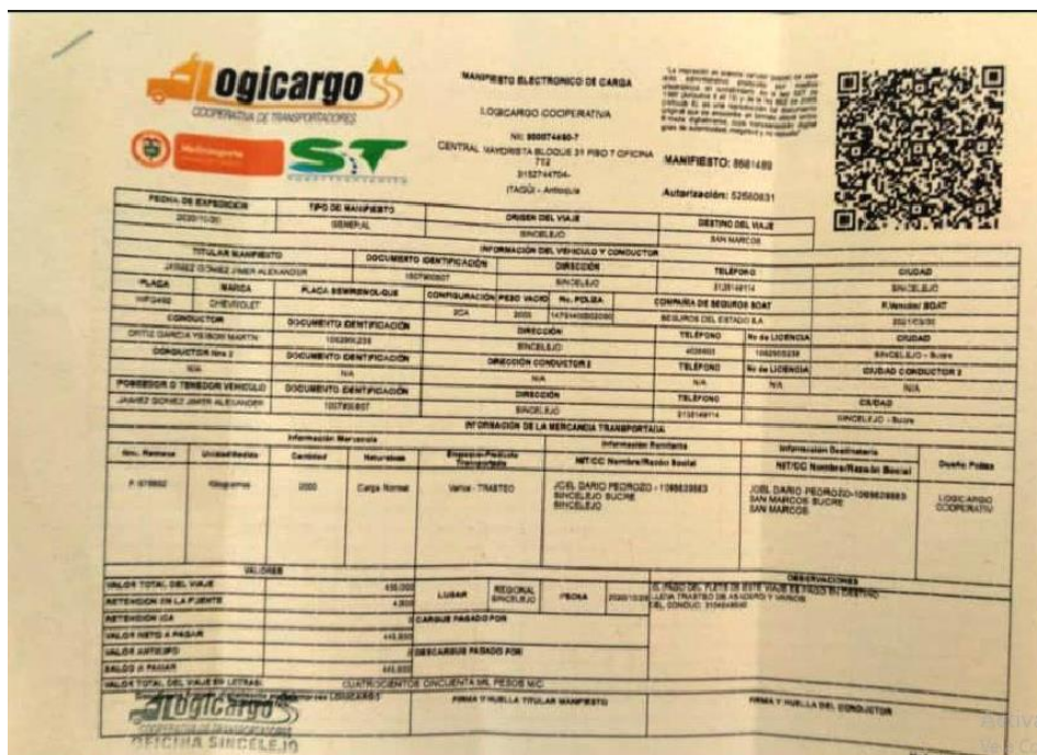
Imagen 13. Manifiesto Electrónico de Carga No. 8661489.

Es así que, esta Dirección de Investigaciones procedió a analizar la precitada solicitud, logrando establecer que (i) el IUIT que originó la inmovilización es el No. 482989 del 20/10/2020, es decir, el informe que nos ocupa para el caso en particular (ii) se aportó entre otros documentos, el Manifiesto Electrónico de Carga No. 8661489, como se muestra a continuación: