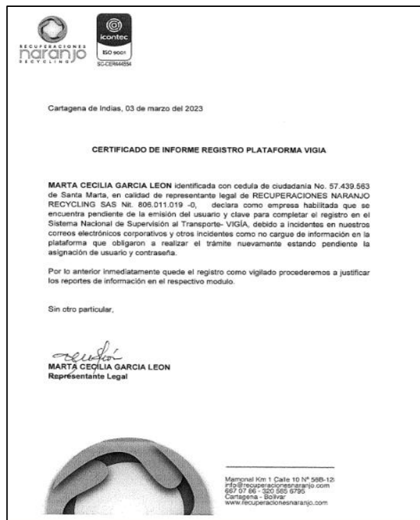
Imagen 3. Información tomada del numeral 1.4. de la información cargada por el vigilado a través del link dispuesto por la sociedad.

Lo anterior, fue analizado por la Dirección de Promoción y Prevención de Tránsito y Transporte Terrestre quien, mediante memorando No. 20238600045763 del 12/05/2023, señaló: