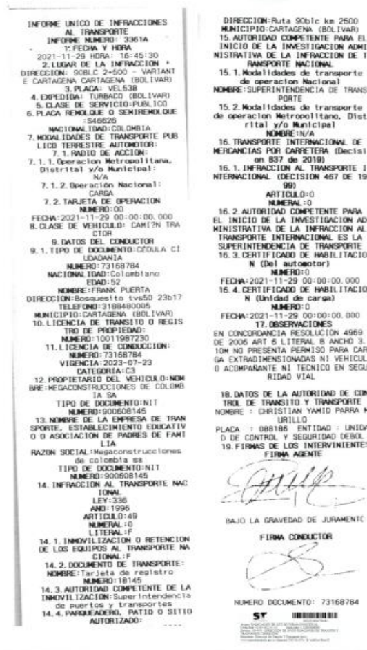
Imagen No. 5 Informe de infracciones de transporte No. 3361A del 29/11/2021, aportado por la DITRA.

16.2.1.1 Ahora bien, este Despacho con el fin de recopilar material probatorio, procedió a verificar la plataforma VIGIA - sistema Nacional de Supervisión al Transporte- en el módulo de "consultas solicitud de inmovilizaciones", utilizando como criterio de búsqueda la placa VEL538, resultado el cual arrojo, una solicitud de salida de vehículo con radicado No. 20215341987042 del 30/11/2021, como se observa a continuación: