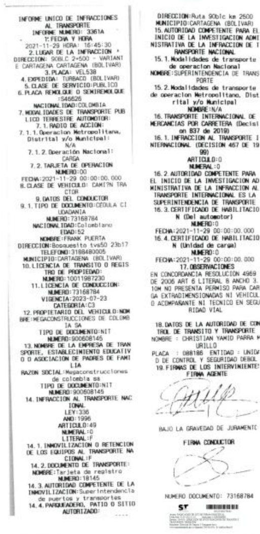
Imagen No. 1 Informe de infracciones de transporte No. 3361A del 29/11/2021, aportado por la DITRA.

Mediante Informe Único de Infracciones al Transporte No. 3361A del 29/11/2021, el agente de tránsito impuso infracción al vehículo de placas VEL538 debido a que conforme a lo descrito en la casilla de observaciones el automotor "(...) no presenta permiso para carga extra dimensionada ni vehículo acompañante, ni técnico en seguridad vial (...) ", como se vislumbra a continuación: