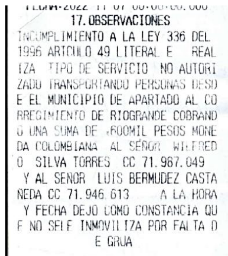
Imagen 1. Tomada del IUIT No. 27613A del 7/11/2022

La autoridad de tránsito impuso el informe Único de Infracción al Transporte No. 27613A del 7/11/2022, al vehículo de placa MLA461, cuya observación consistió en: