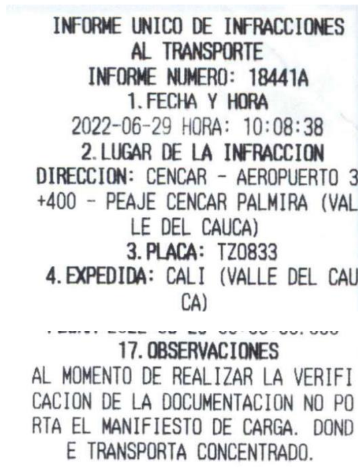
Imagen No. 1 Informe de infracciones de transporte No. 18441 A de 29/06/2022, aportado por la DITRA.

Mediante Informe Único de Infracciones al Transporte No. 18441 A de 29/06/2022 el agente de tránsito impuso infracción al vehículo de placas TZO833 debido a que conforme a lo descrito en la casilla de observaciones el automotor "(...) se consulta en la página del ministerio de transporte y no se encuentra manifiesto de carga (...)", como se vislumbra a continuación: