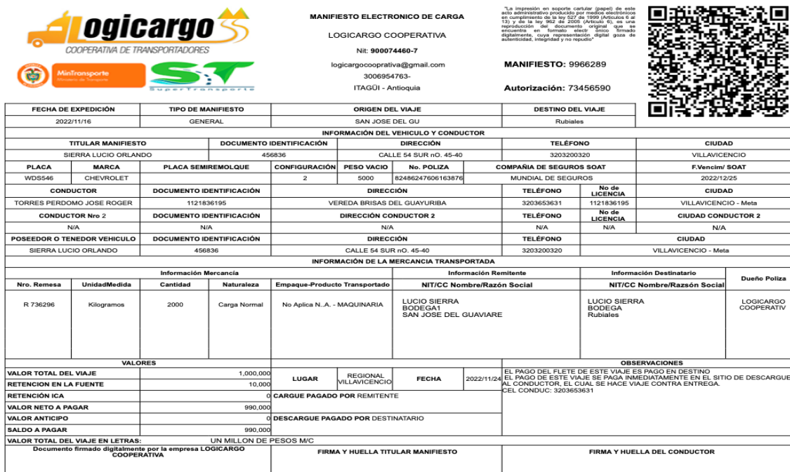
Imagen 3. Manifiesto Electrónico de Carga No. 9966289.

Es así que, esta Dirección de Investigaciones procedió a analizar la precitada solicitud, logrando establecer que (i) el IUIT que originó la inmovilización es el No. 11395A del 16/11/2022, es decir, el informe que nos ocupa para el caso en particular (ii) se aportó entre otros documentos, el Manifiesto Electrónico de Carga No. 9966289, como se muestra a continuación: