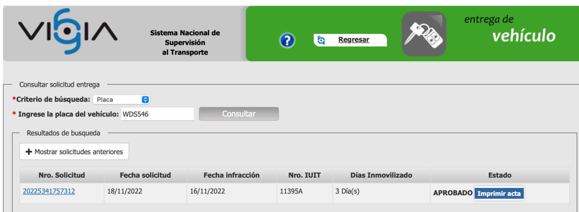
Imagen 2. Consulta ST realizada al link http://vigia.supertransporte.gov.co en el aplicativo VIGIA

como criterio de búsqueda la placa WDS546, resultado el cual arroja, una solicitud de salida de vehículo con radicado No. 20225341757312 del 18/11/2022, como se observa a continuación: