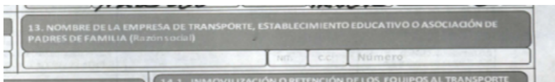
Imagen No. 1 IUIT (Informe Único de Infracción al Transporte) No. 631900000651 de 9/12/22

Que, en el presente caso, tenemos que mediante radicado No. 20235341612712 de 13/07/2023, se allegó el informe Único de Infracción al Transporte No. 631900000651 de 9/12/22, impuesto al vehículo de placa SMH549, dejando en espacio en blanco el sujeto infractor y siendo ilegible la casilla No. 17 de las observaciones como se puede evidenciar en lo siguiente: