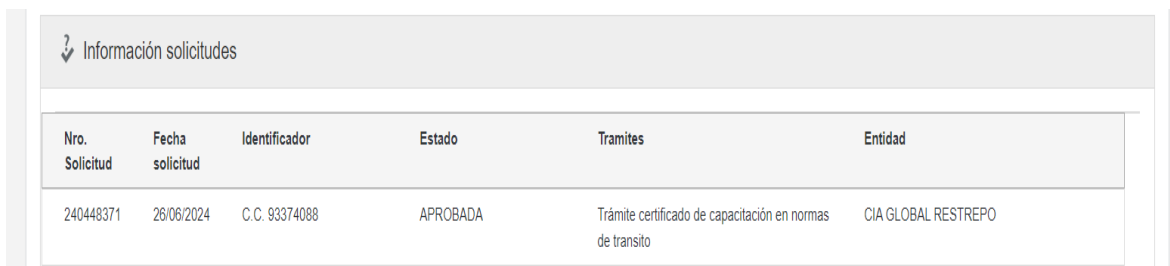
Imagen No 8 Captura de pantalla tomada de la consulta Realiza en el RUNT, identificado con cedula No 93.374.088

De la anterior situación, se evidencia una presunta irregularidad, ya que el CENTRO INTEGRAL DE ATENCIÓN CIA GLOBAL RESTREPO , certifico a un infractor, del cual el procedimiento no se realizó en debida forma en concordancia procedimiento descrito en el artículo 48 de la Resolución No. 20203040011355 del 21 de agosto de 2020 para obtener el Certificado del Curso en Normas de Tránsito.