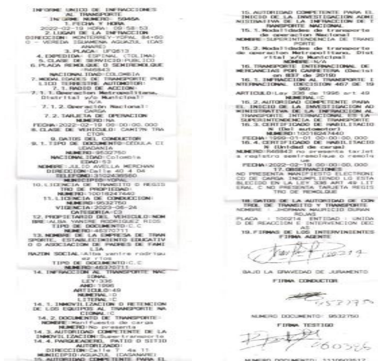
Imagen 1. Informe Único de Infracciones al Transporte No. 5946A del 19/02/2022

Mediante Informe Único de infracciones al Transporte No. 5946A del 19/02/2022, el agente de tránsito impuso infracción al vehículo de placas UFQ613 debido a que conforme a lo descrito en la casilla de observaciones el automotor: "(...)no presenta manifiesto electrónico de carga" así: