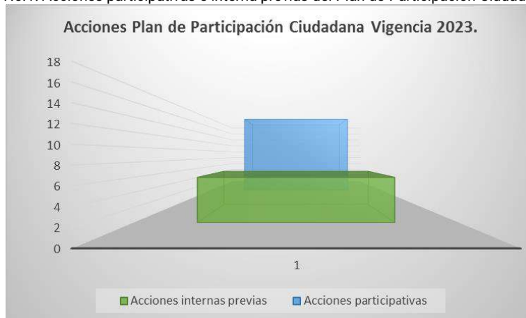
Imagen No.1: Acciones participativas e interna previas del Plan de Participación Ciudadana 2023.