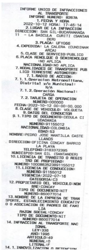
Imagen 1 IUIT No. 8267A del 12/10/2022.

Mediante Informe Único de Infracciones al Transporte No. 8267A del 12/10/2022, el agente de tránsito impuso infracción al vehículo de placas UFY066 debido a que conforme a lo descrito en la casilla de observaciones el automotor “(...) transporta un sobrepeso de 220 kg según tiquete de báscula No. 000554. Carga propia de la empresa Concay (...)”, como se vislumbra a continuación: