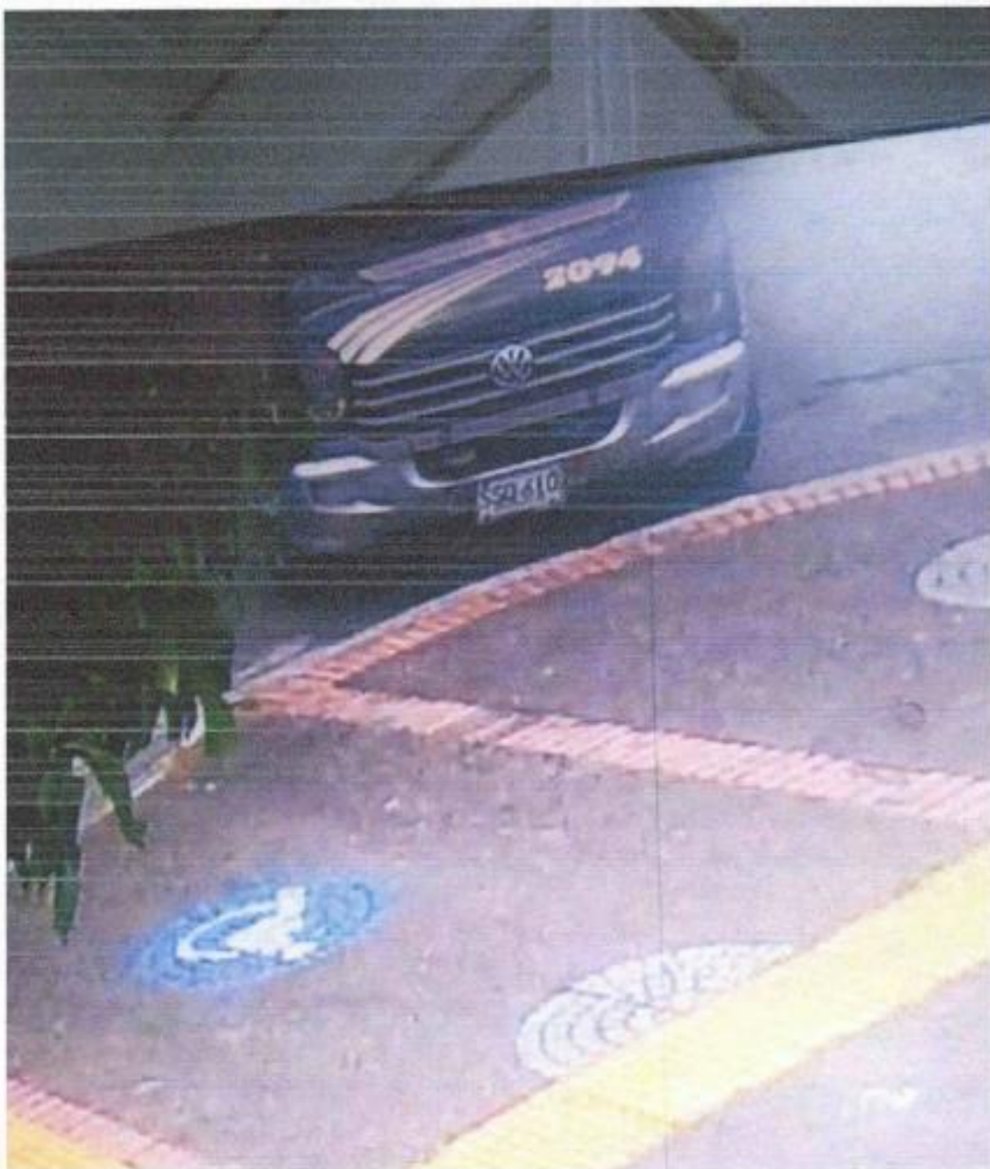
Imágenes 1 y 2. Tomadas del radicado 20235342394372 del 29 de septiembre de 2023.

"Por la cual se abre una investigación administrativa mediante la formulación de pliego de cargos en contra de la COOPERATIVA ESPECIALIZADA DE TRANSPORTADORES SIMÓN BOLÍVAR, EN REORGANIZACIÓN, con NIT. 800174156-9 "