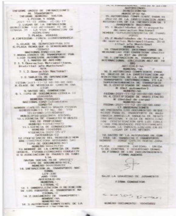
Imagen No.3 Informe de infracciones de transporte No. 10572A del 12/11/2021, aportado por la DITRA

"Por la cual se abre una investigación administrativa mediante la formulación de pliego de cargos en contra de la empresa BLUE SERVICES S.A.S"