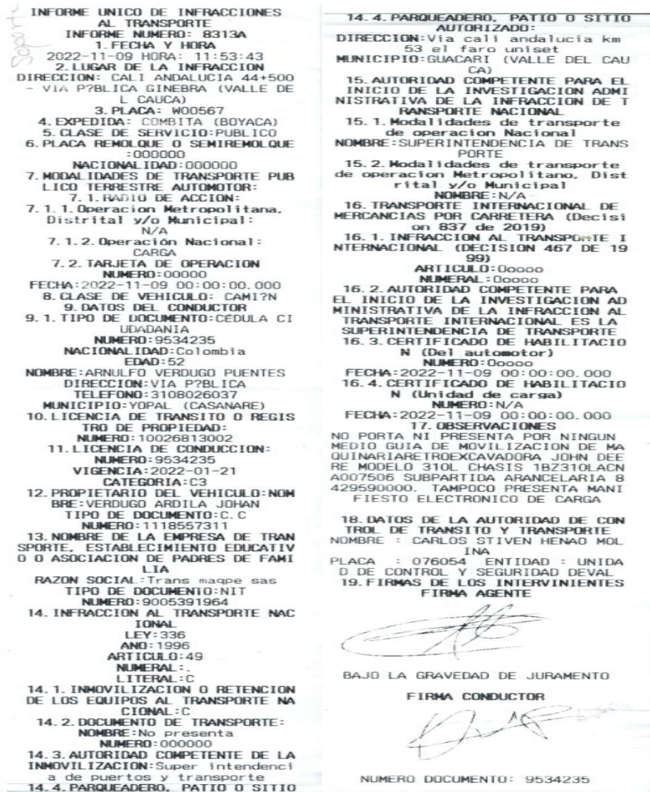
Imagen No.5 Informe de infracciones de transporte No. 8313A de 09/11/2022, aportado por la DITRA

"Por la cual se abre una investigación administrativa mediante la formulación de pliego de cargos en contra de la empresa TRANS MAQPE S A S "