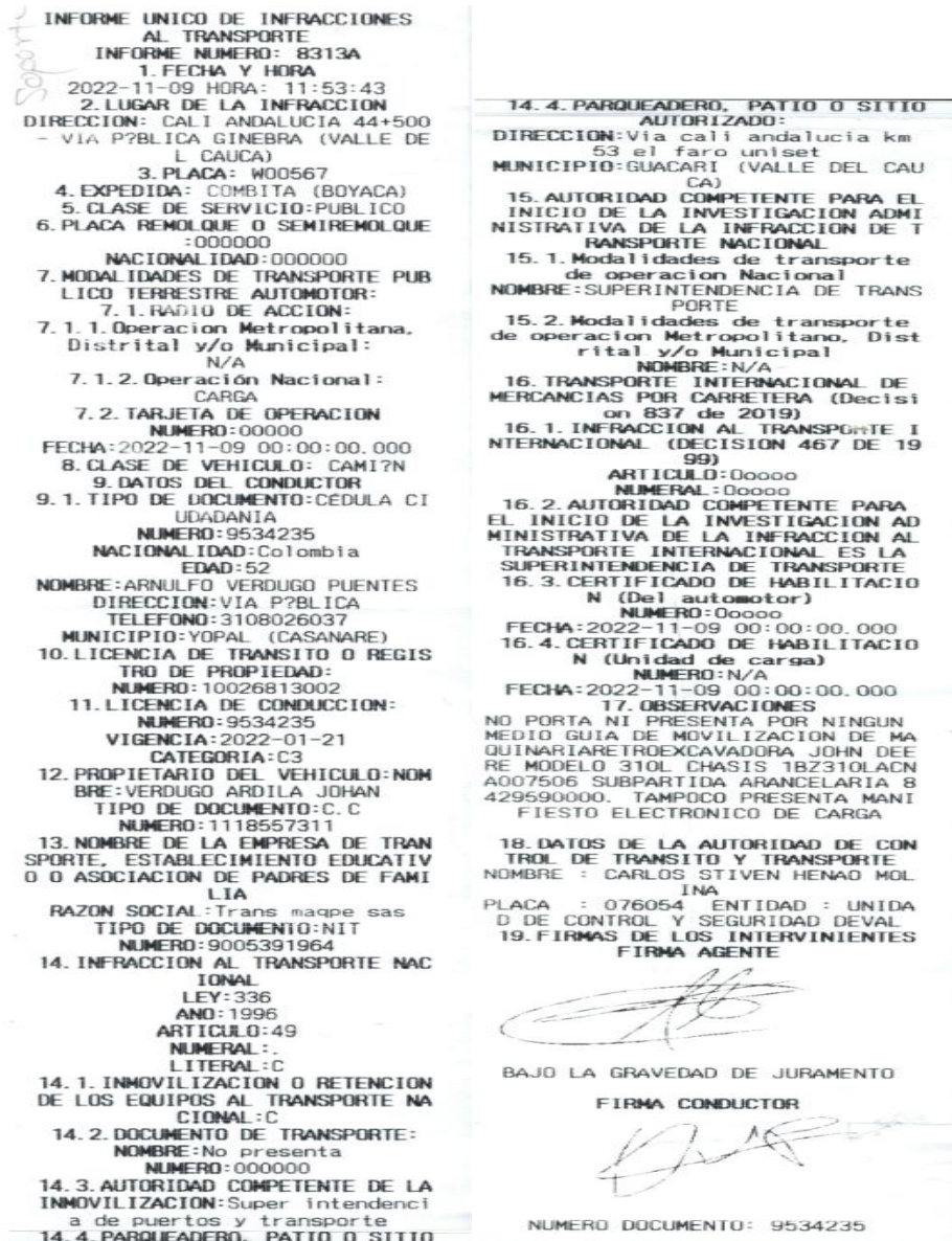
Imagen No.1 Informe de infracciones de transporte No. 8313A de 09/11/2022, aportado por la DITRA

porta ni presenta por ningún medio guía de movilización de maquinaria retroexcavadora john deere modelo 310L (...)" (Sic), así: