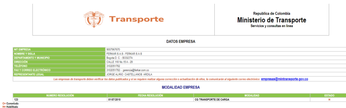
Imagen No. 2.

SÉPTIMO: Que, en el ejercicio de vigilancia, inspección y control del cual es competente esta Superintendencia de Transporte con relación a las empresas de Transporte de Carga, se logró evidenciar que la sociedad FERKAR S.A.S. hoy COLCARGA TRANSPORTE S.A.S. con NIT 900796767-0 fue habilitada por el Ministerio de Transporte como empresa de transporte de carga a través de la resolución 123 del 01 de julio de 2015 tal y como se demuestra a continuación: