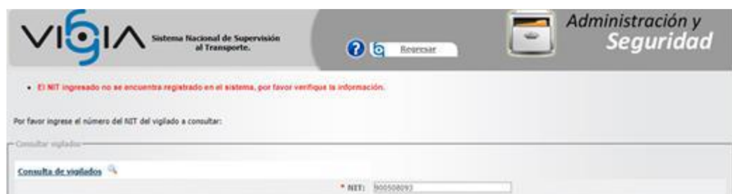
Imagen 2. Información tomada del numeral 2.4. del memorando 20238600045713 del 12 de mayo de 2023

[...] Ecosistemas del Oriente S.A.S. presuntamente no cumple con lo dispuesto en la Circular 4 de 2011, al no acatar las resoluciones como la 1170 de 2022, mediante la cual se dieron instrucciones para el reporte de información subjetiva en el Sistema Nacional de Supervisión al Transporte -Vigía-, por lo tanto, se presume que no ha realizado la cancelación de las correspondientes tasas de contribución, conforme la validación realizada directamente en el aplicativo el día 24 de abril de 2023: