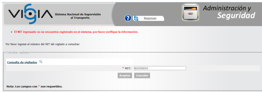
Imagen 3. Consulta realizada el 27 de noviembre de 2023 a través del Sistema Nacional de Supervisión al Transporte - VIGIA- usando el NIT de la investigada para la búsqueda.

De lo anterior, se puede observar que, la sociedad ECOSISTEMAS DEL ORIENTE S.A.S. con NIT 900508093 - 1 no se registró en el Sistema Nacional de Supervisión de Transporte – VIGIA y por tal razón no ha reportado sus estados financieros desde su habilitación como empresa desintegradora de vehículos.