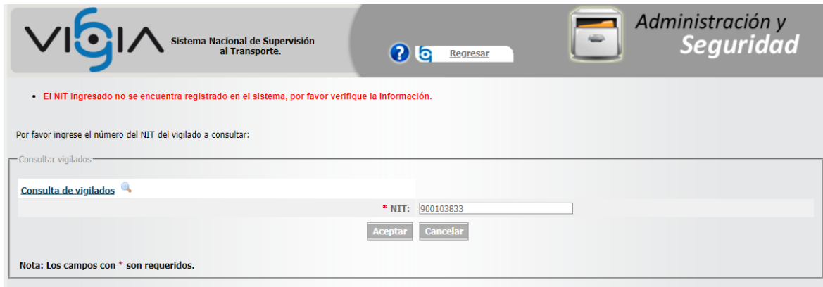
Imagen 4. Consulta realizada el 11 de diciembre de 2023 a través del Sistema Nacional de Supervisión al Transporte - VIGIA- usando el NIT de la investigada para la búsqueda.

En este orden de ideas, se procedió a verificar por parte de esta Dirección de Investigaciones de Tránsito y Transporte Terrestre lo informado por la Dirección de Promoción y Prevención, a través del aplicativo "VIGIA" encontrando lo siguiente: