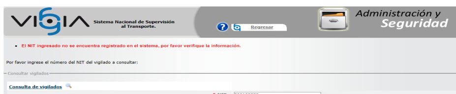
Imagen 3. Información tomada del numeral 2.4. del memorando 20238600045783 del 12 de mayo de 2023

La empresa S.I Metales La Unión S.A.S. no cumple con lo dispuesto en la Circular 4 de 2011, ni acata resoluciones como la 1170 de 2022, mediante la cual se dieron instrucciones para el reporte de información subjetiva en el Sistema Nacional de Supervisión al Transporte – Vigía-, por lo tanto, se presume que no ha realizado la cancelación de las correspondientes tasas de contribución. Conforme la validación realizada directamente en el aplicativo el día 27 de abril de 2023 para el NIT 900.103.833-6: