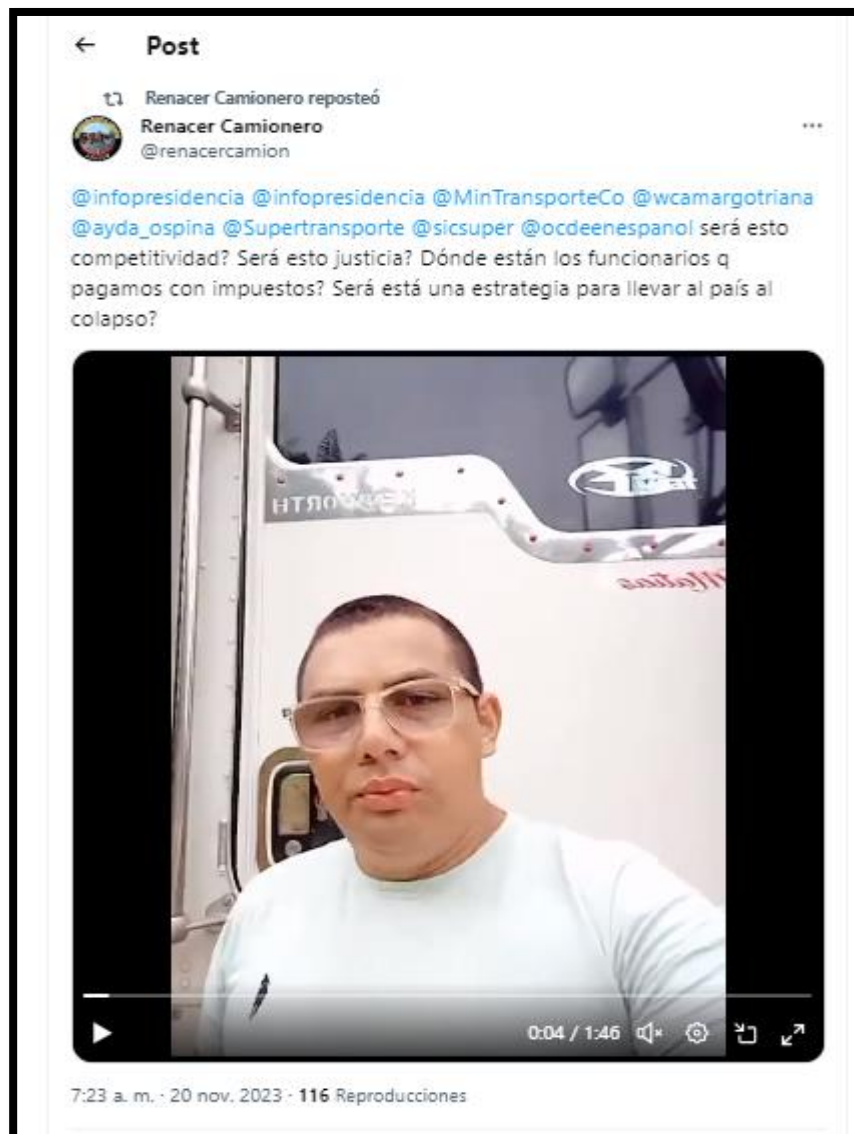
Imagen No. 2

Fuente: Video plataforma X del 20 de noviembre de 2023 8