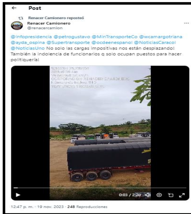
Imagen No. 1