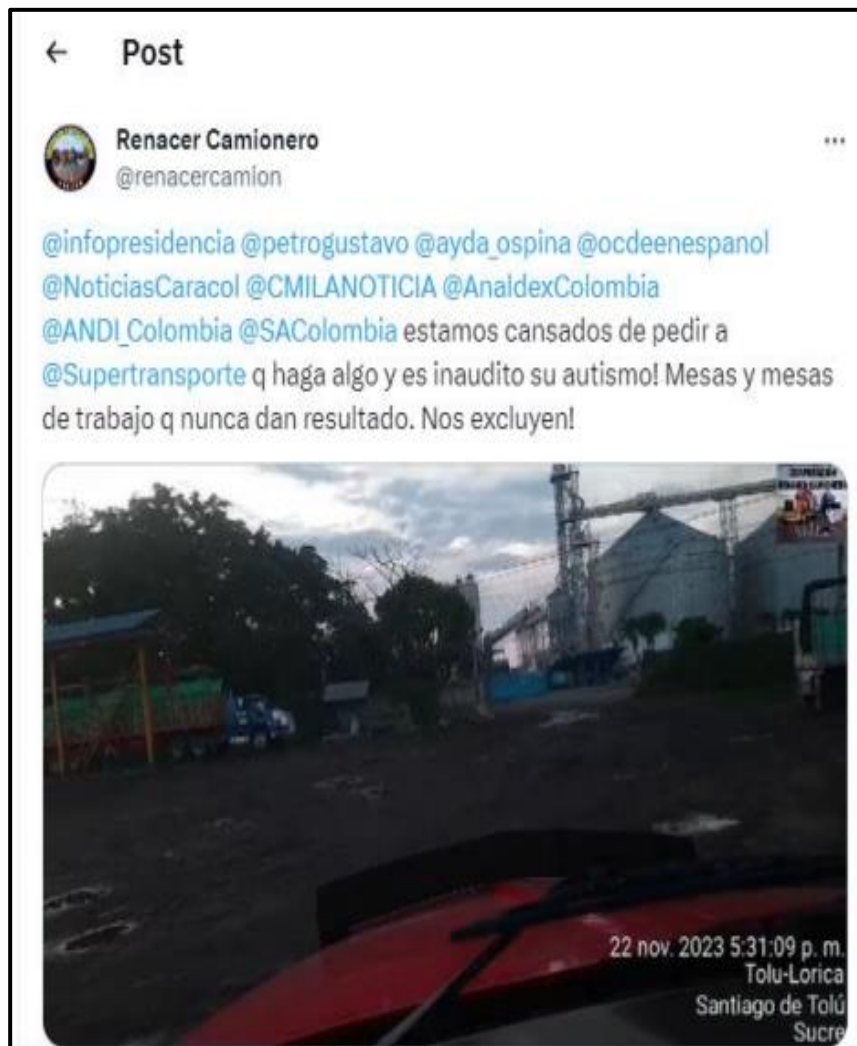
Imagen No. 3

Fuente: Video plataforma X del 22 de noviembre de 2023 9