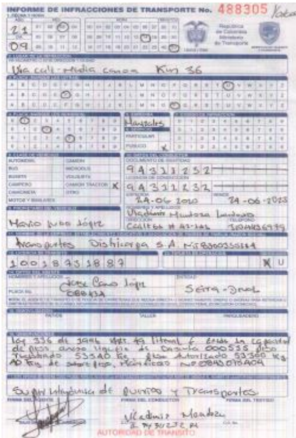
Imagen 1. IUIT No. 488305 del 09/03/2021.