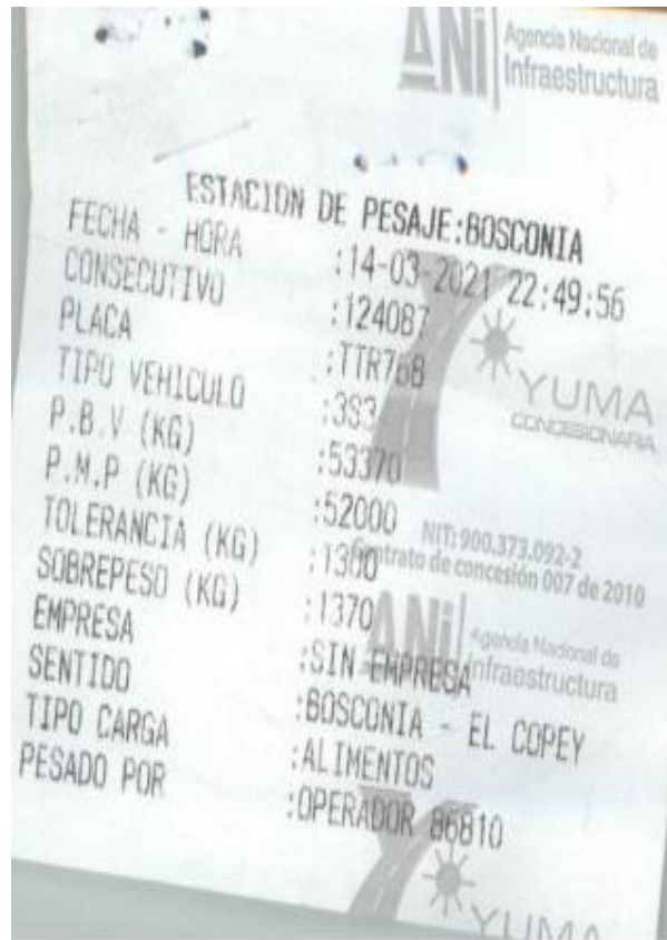
Imagen 2. Tiquete de báscula No. 124087.

Que, una vez analizado el precitado informe, este Despacho evidenció que, en la casilla 11 del IUIT, el agente identificó a la empresa Transportadora Regional S.A.- Transregional S.A., como presunto infractor, hecho por el cual, con el fin de recopilar material probatorio que permitiese identificar la empresa de servicio público de transporte de carga encargada de la operación, se procedió a consultar el manifiesto electrónico de carga No. 21068, el cual fue relacionado en la casilla de observaciones por parte del agente de la DITRA, y en ese sentido, se verificó por parte de esta Dirección de Investigaciones, la plataforma del RNDC a través de la consulta pública los manifiestos expedidos para el mes de marzo de 2021 al vehículo de placas TTR768, vislumbrando que el manifiesto de carga No. 21068 fue expedido por la empresa TRANSCOMIN S.A.S. , así: