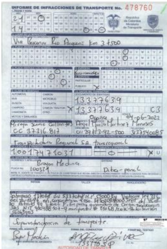
Imagen 1. IUIT No. 478760 del 14/03/2021.