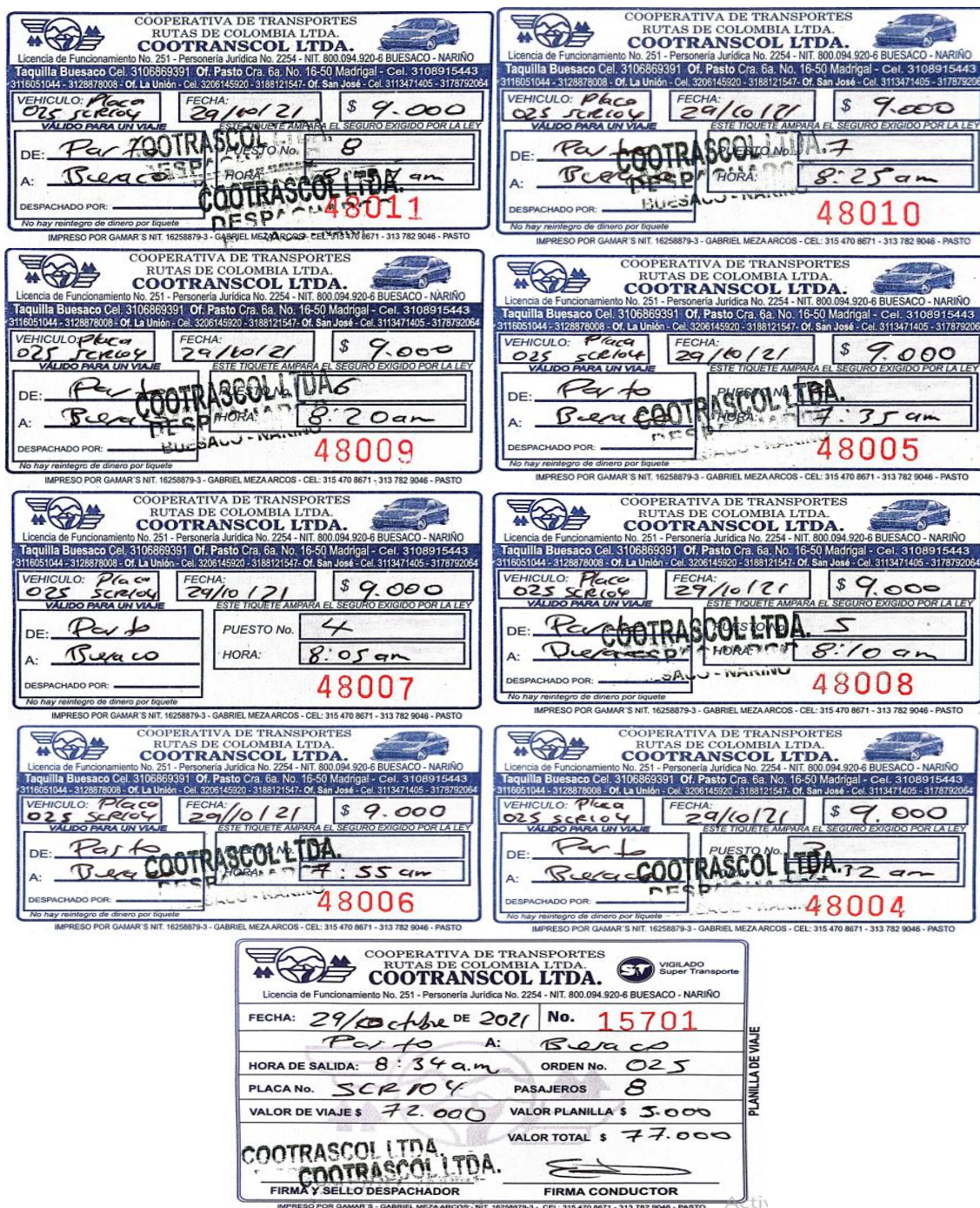
Imagen 2: Extraída del Radicado No. 20245341150992 y 20245341151602

Frente a la comisión de la conducta infractora, previa solicitud probatoria por parte de la investigada, este Despacho admitió como pruebas los tiquetes de transporte expedidos por la COOPERATIVA DE TRANSPORTADORES RUTAS DE COLOMBIA- COOTRASCOL LTDA , del día 29 de octubre del 2021 y la planilla del vehículo de placa SCR104. En ese sentido, corresponde a esta dirección determinar si hubo o no, responsabilidad de la empresa investigada en los hechos, conforme a lo obrante en el expediente y a las pruebas admitidas.