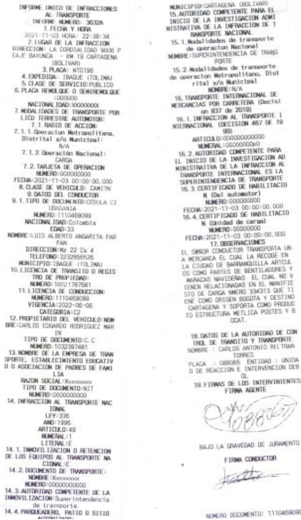
Imagen 1. Informe Único de Infracciones al Transporte No. 3632A

"Por la cual se abre una investigación administrativa mediante la formulación de pliego de cargos en contra de la empresa TRANSPORTES AGUILA LIMITADA. "