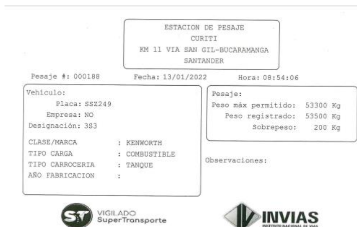
Imagen 2. tiquete de báscula No. 000188 del 13/01/2022.

Corolario de lo anterior y con el fin de detallar las operaciones de transporte, este Despacho procede a extraer del material probatorio aportado los datos principales de las operaciones previamente descritas, así: