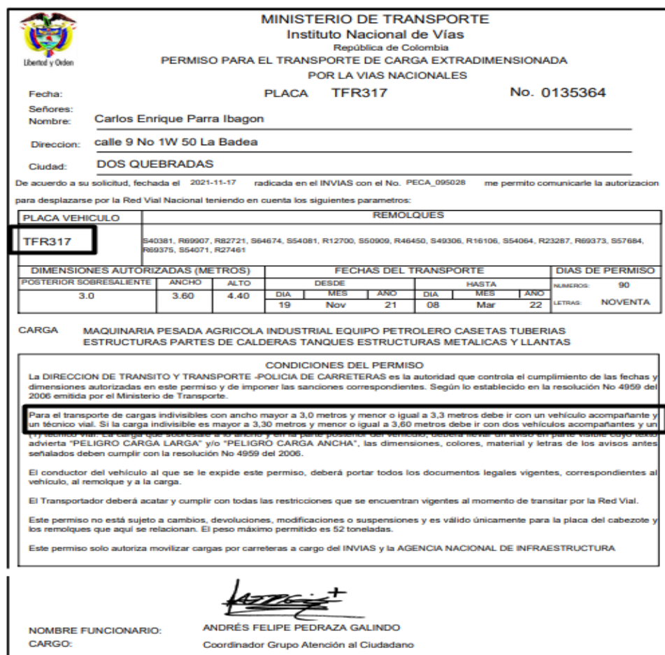
Imagen 4. Permiso para el transporte de carga extradimensionada No. 0135364

Conforme al precitado material probatorio, esta Dirección de Investigaciones logra establecer que presuntamente la empresa MOVITRAM S.A.S. con NIT 900316025-6 se encontraba presuntamente infringiendo las normas al sector transporte, toda vez que, el vehículo de placas TFR317 se encontraba transportado una excavadora con una anchura total de 3.20 Metros sin vehículo acompañante, carga extradimensionada que conforme al permiso No. 0135364 concedido debía ser transportada con un vehículo acompañante y técnico en seguridad vial, con el cual no contaba durante el desarrollo de esta operación de transporte que se encontraba realizando.