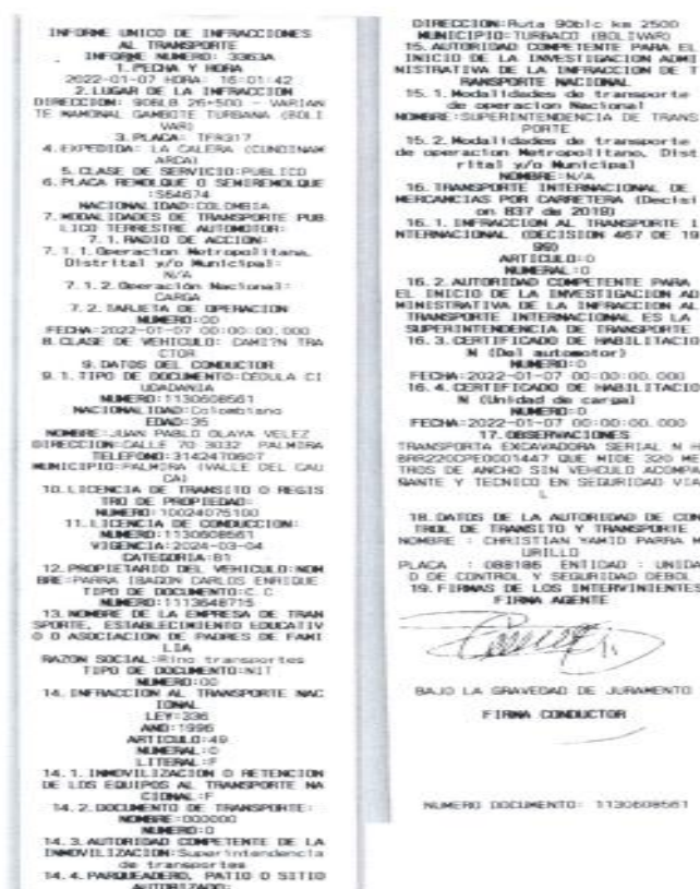
Imagen No. 1 Informe de infracciones de transporte No. 3363 a del 07/01/2022, aportado por la DITRA.

Mediante Informe Único de Infracciones al Transporte No. 3363A del 07/01/2022, el agente de tránsito impuso infracción al vehículo de placas TFR317 debido a que conforme a lo descrito en la casilla de observaciones el automotor "(...) TRANSPORTA EXCAVADORA SERIAL N H BRR220CPE0001447 QUE MIDE 320 METROS DE ANCHO SIN VEHICULO ACOMPAÑANTE Y TÉCNICO EN SEGURIDAD VIAL. (...) ", como se vislumbra a continuación: