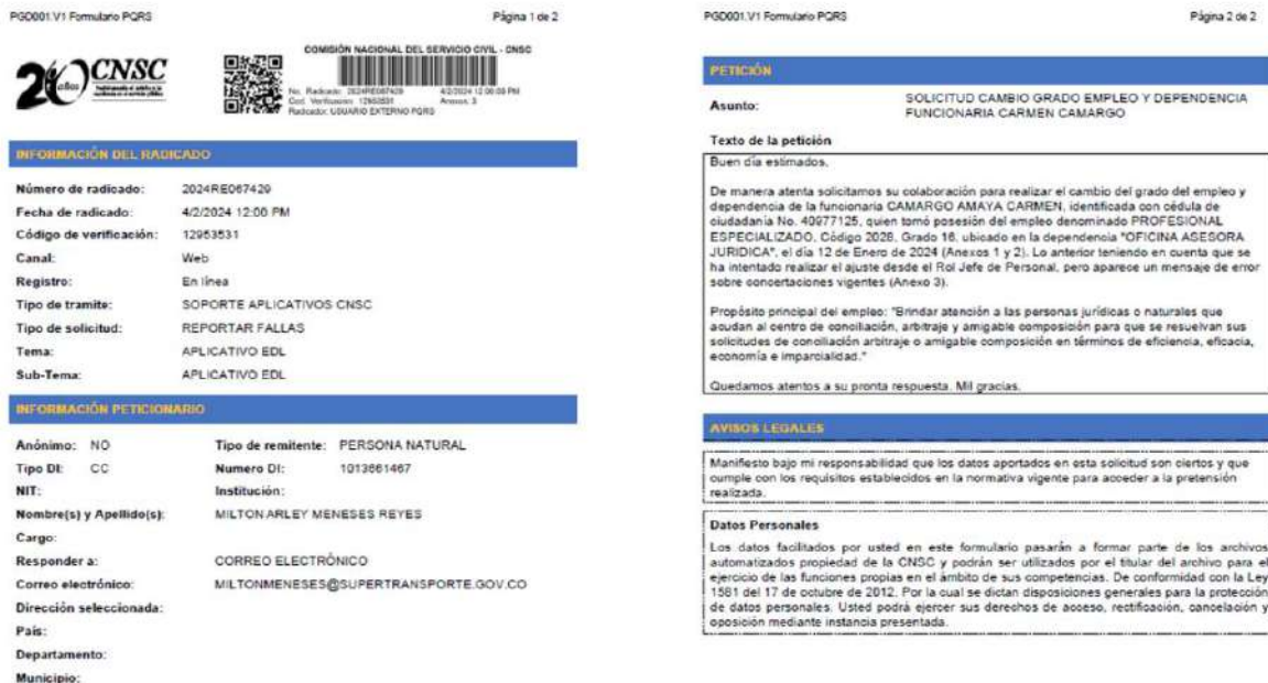
Imagen No. 6. Reporte a la CNSC