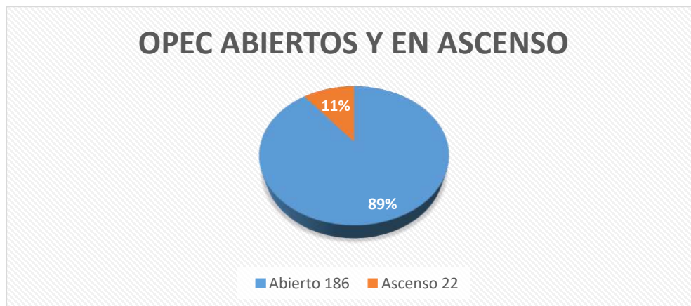
Imagen No.2. OPEC reportadas vigencia 2023