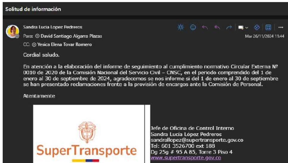
Imagen No.1. Correo a comisión de personal