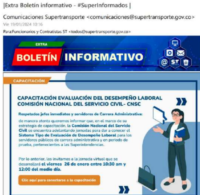
Imagen No. 5. Información sobre Evaluación de Desempeño Laboral