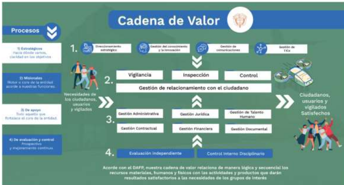
Ilustración 1. Cadena de Valor.