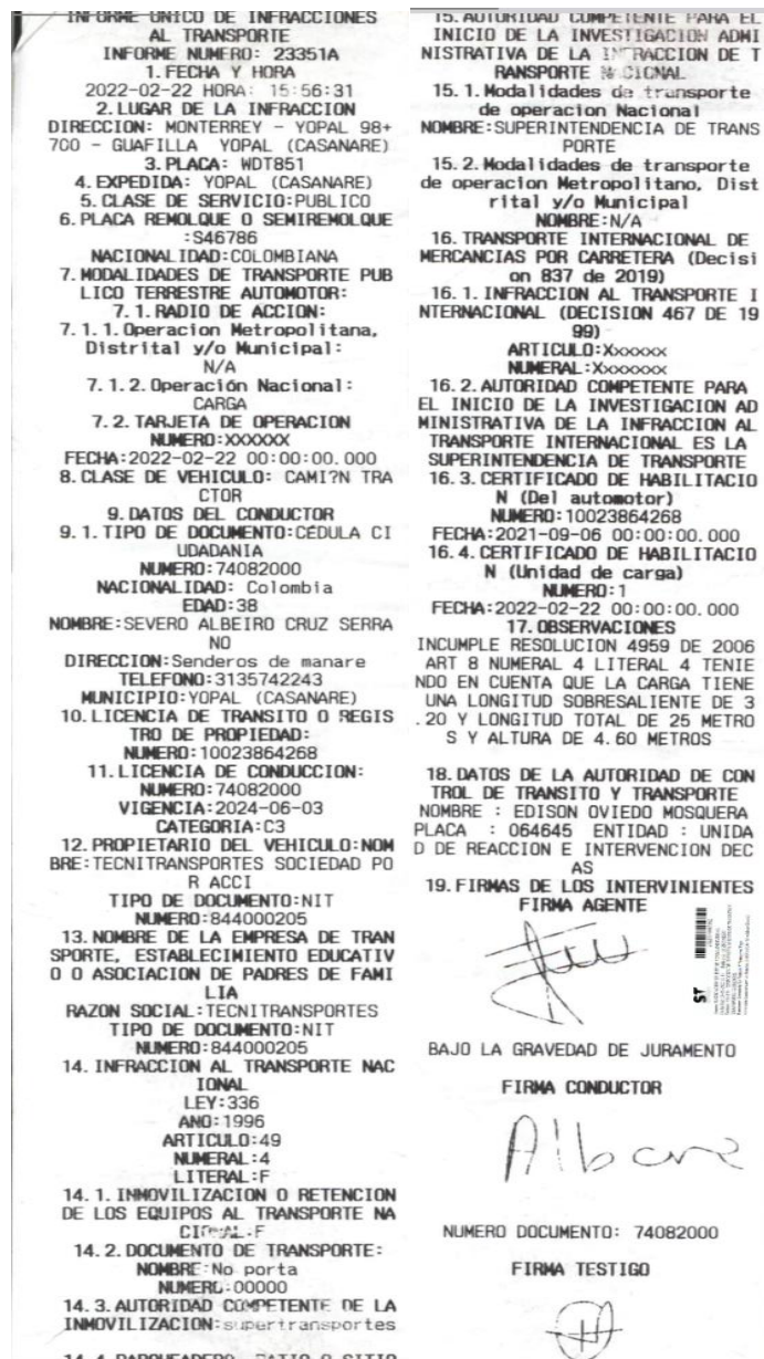
Imagen No. 1 Informe de infracciones de transporte No. 23351A del 22/02/2022, aportado por la DITRA.

Mediante Informe Único de Infracciones al Transporte No. 23351A del 22/02/2022 , el agente de tránsito impuso infracción al vehículo de placas WDT851 debido a que conforme a lo descrito en la casilla de observaciones el automotor “(...) INCUMPLE RESOLUCIÓN 4959 DE 2006 ART 8 NUMERAL 4 LITERAL 4 TENIENDO EN CUENTA QUE LA CARGA TIENE UNA LONGITUD SOBRESALIENTE DE 3.20 Y LONGITUD TOTAL DE 25 METROS Y ALTURA DE 4.60 METROS.(...) ”, como se vislumbra a continuación: